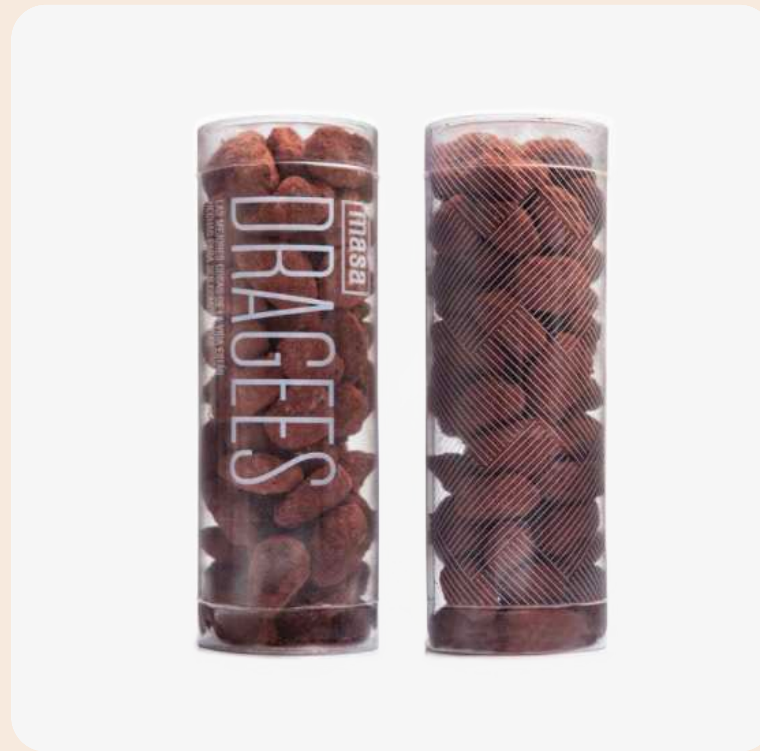
Dragges de Almendras* cubiertas con chocolate y cocoa