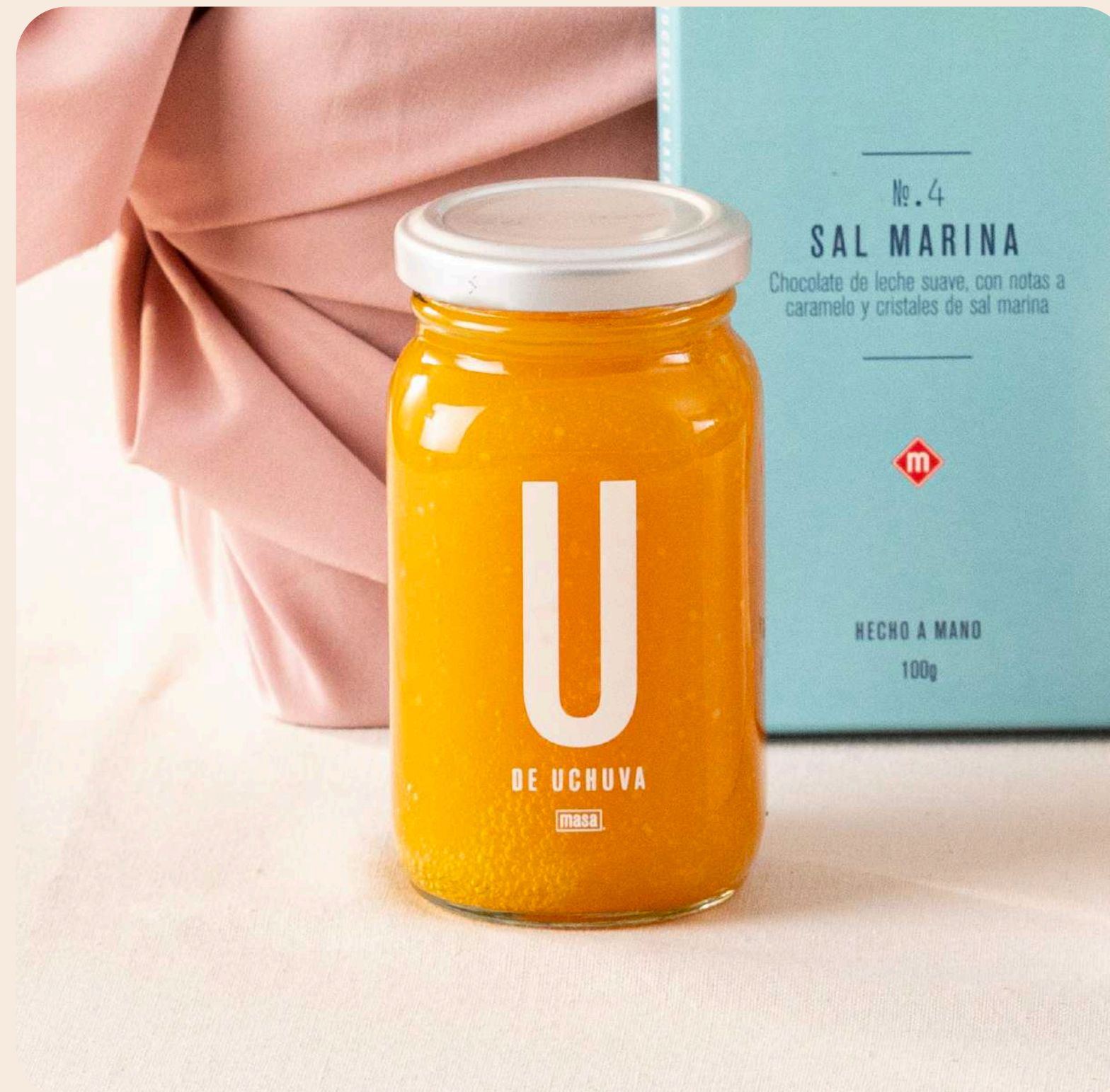
Mermelada 250g fresa, mora o lulo