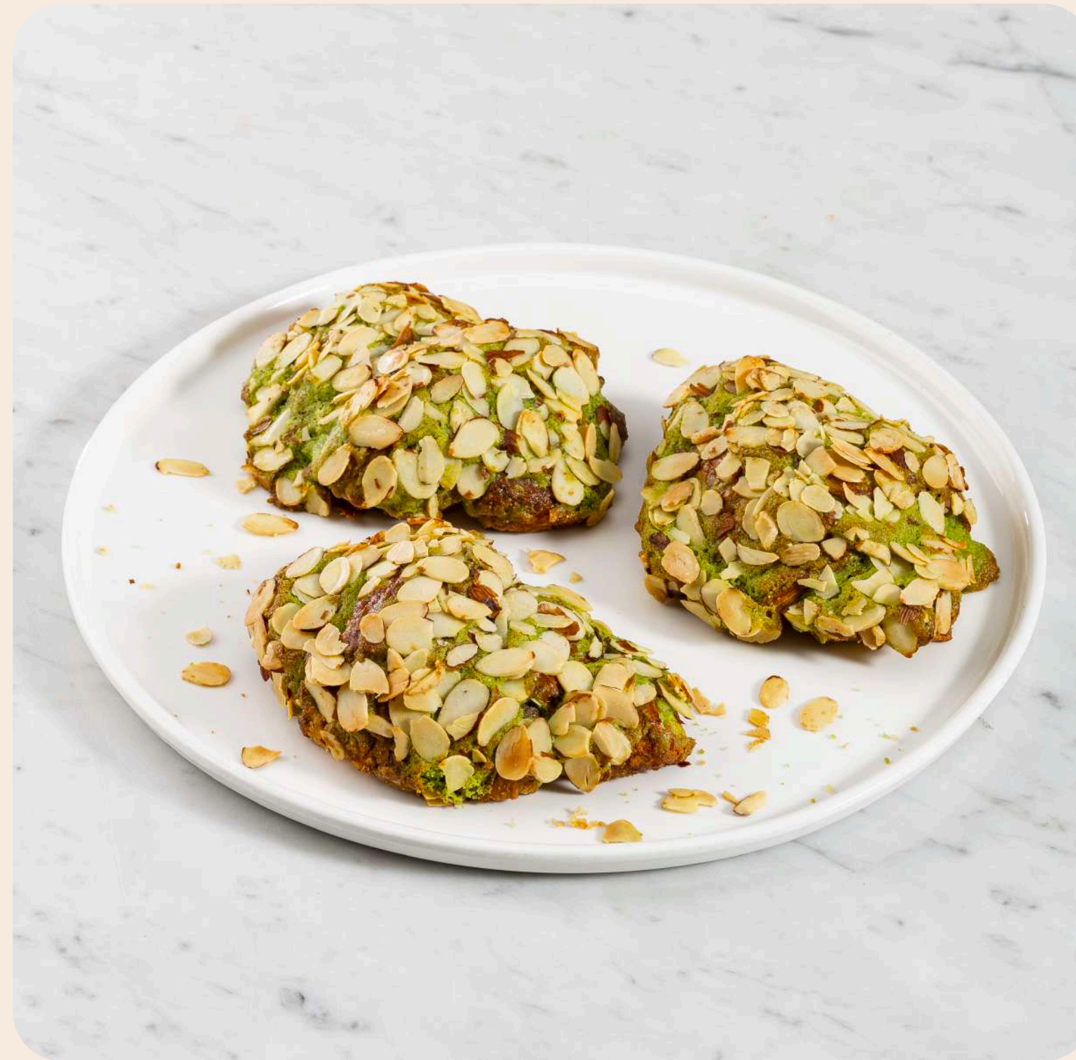
Croissant de Pistacho* (Caja 3 unidades)