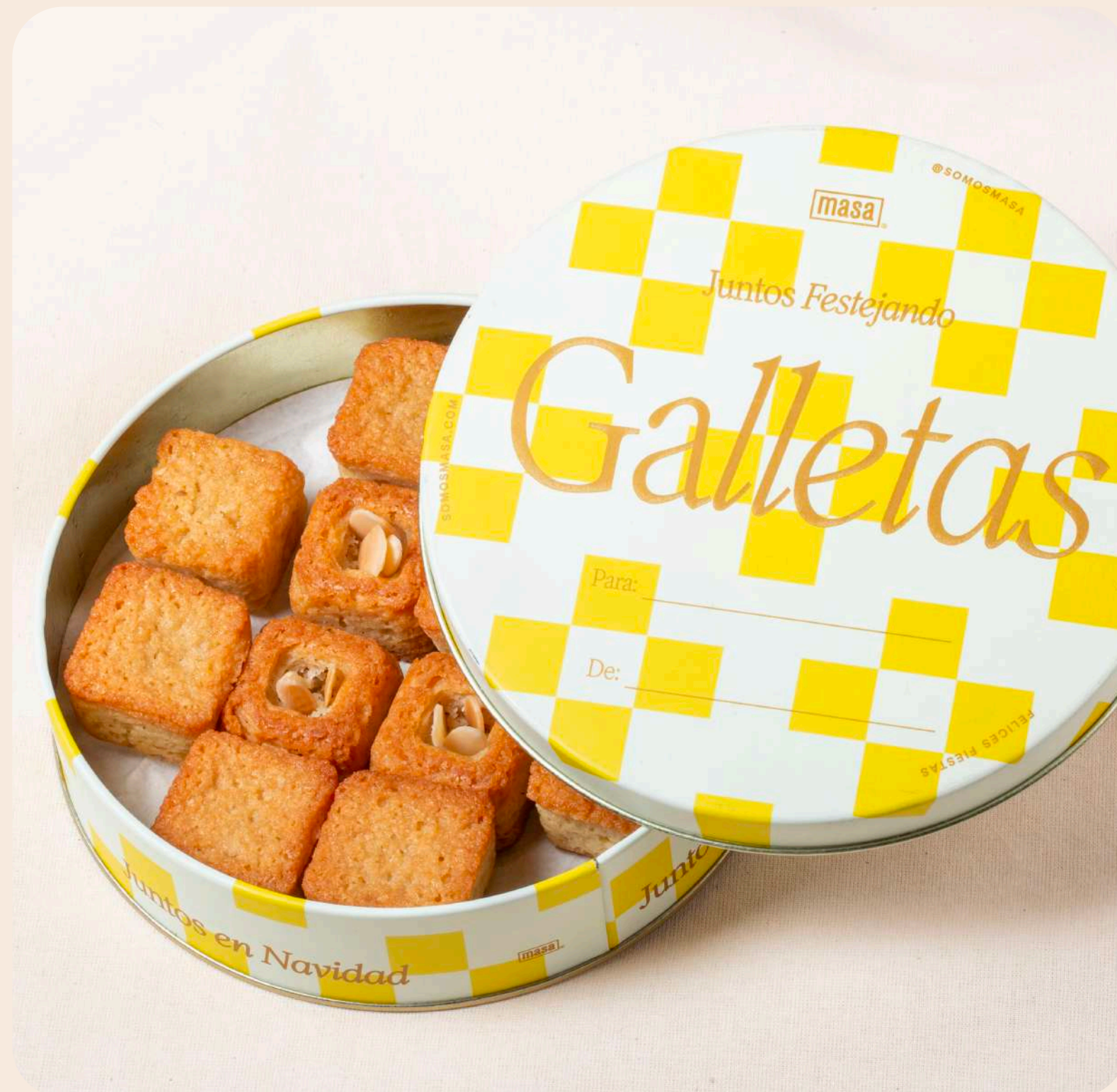
Lata de Galletas Financier*