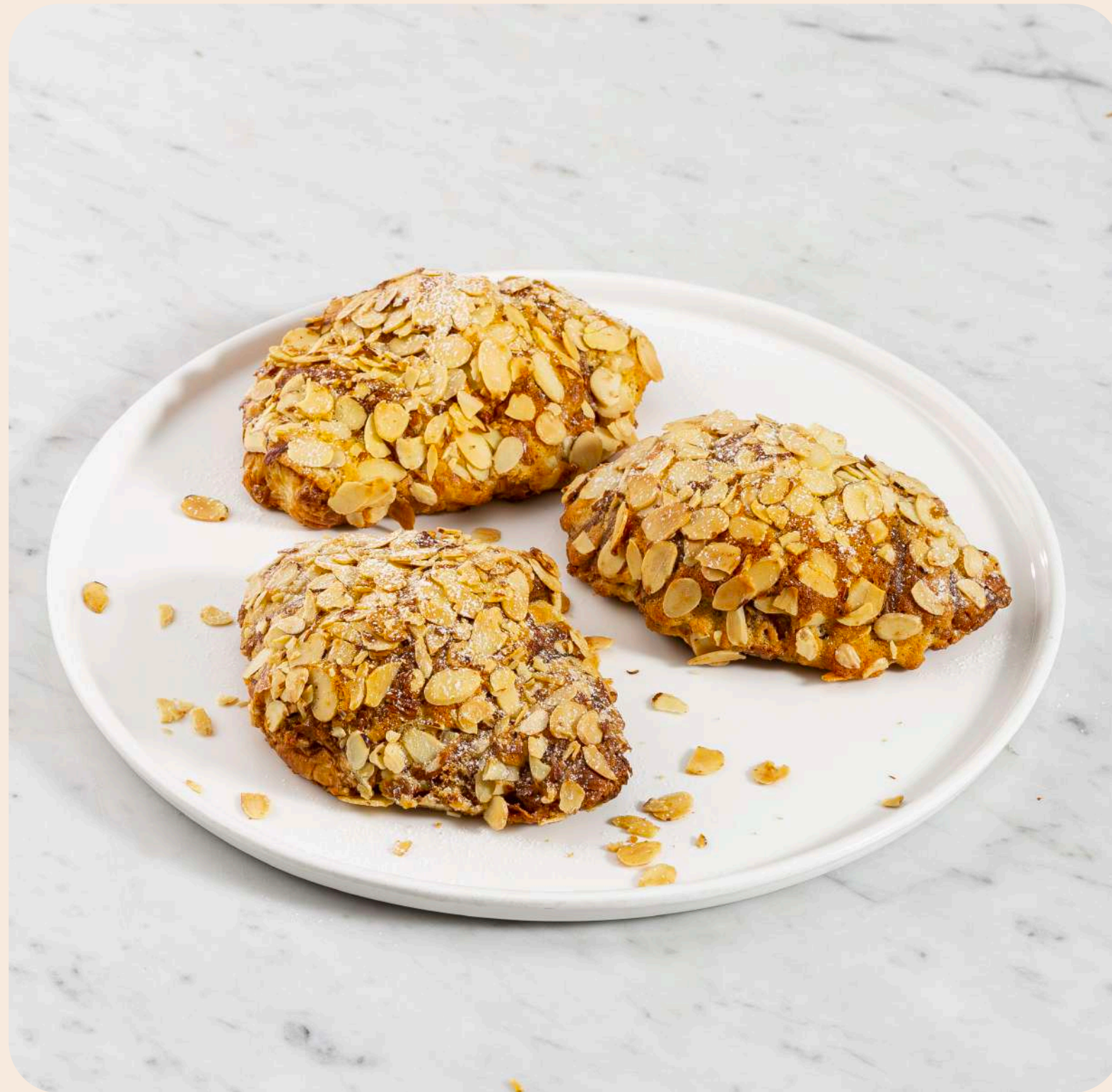
Croissant de Almendras* (Caja 3 unidades)