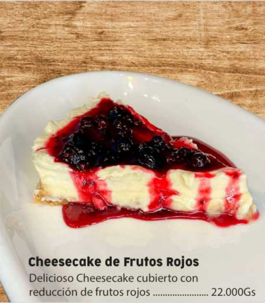
Cheesecake de Frutos Rojos Delicioso Cheesecake cubierto con reducción de frutos rojos ..... 22.000Gs