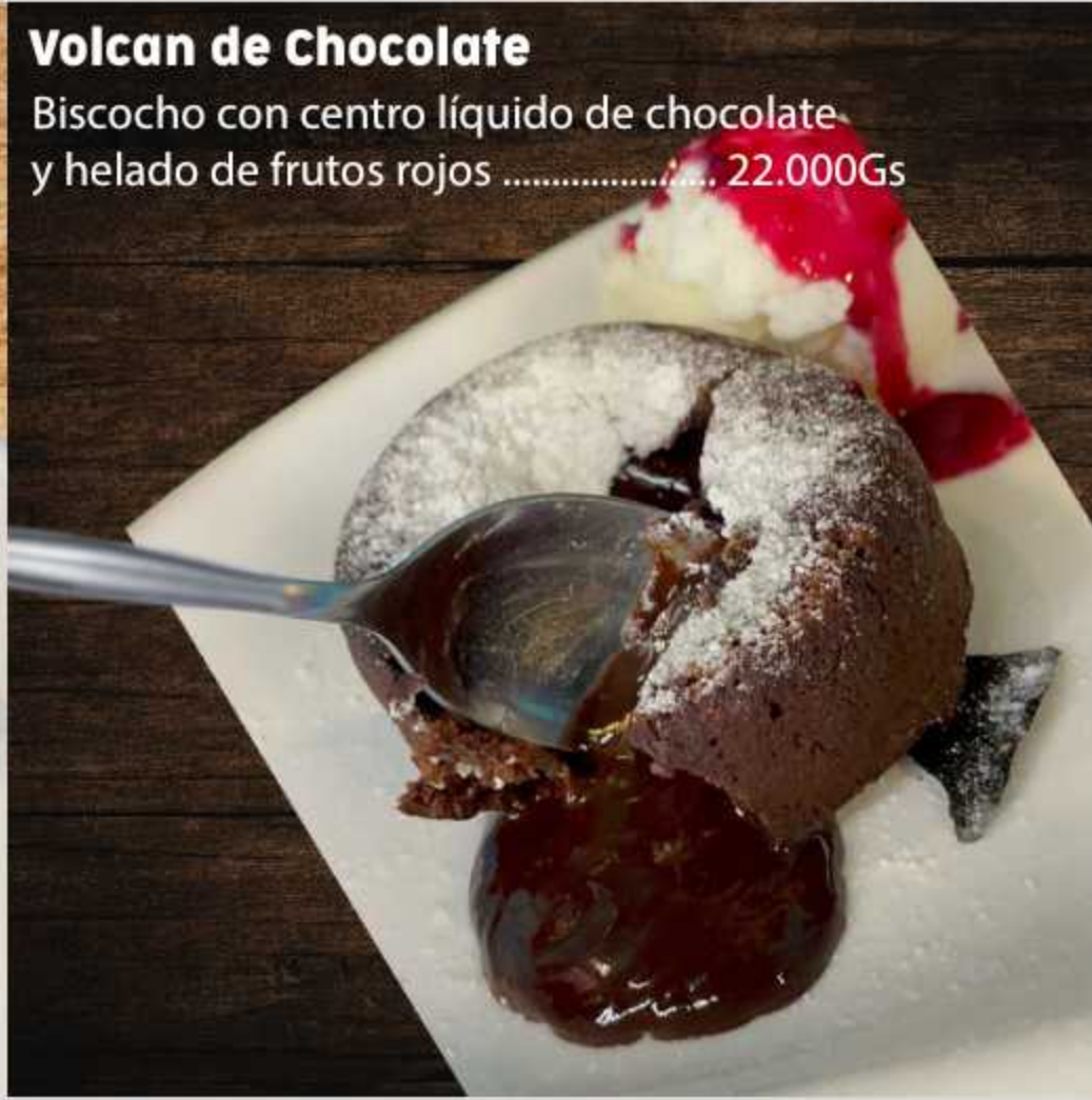
Volcan de Chocolate Biscocho con centro líquido de chocolate y helado de frutos rojos ..... 22.000Gs