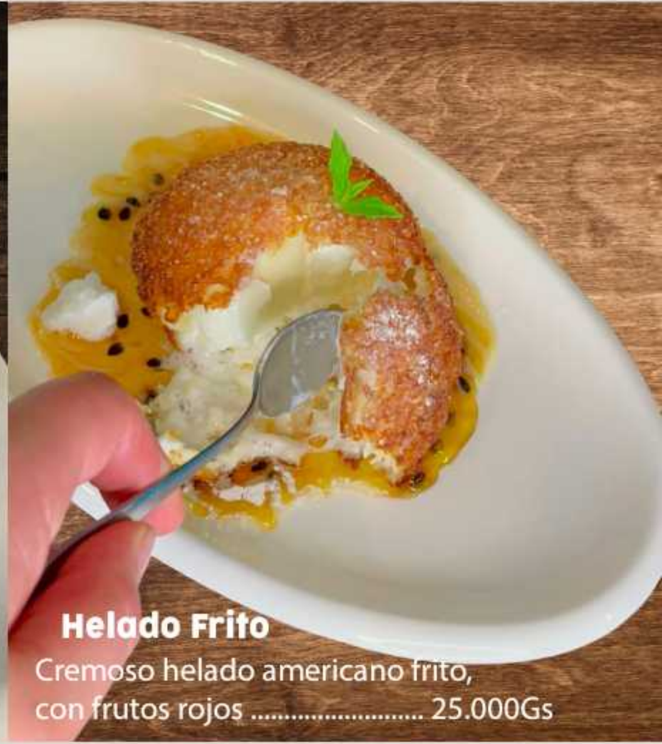
Helado Frito Cremoso helado americano frito, con frutos rojos ..... 25.000Gs