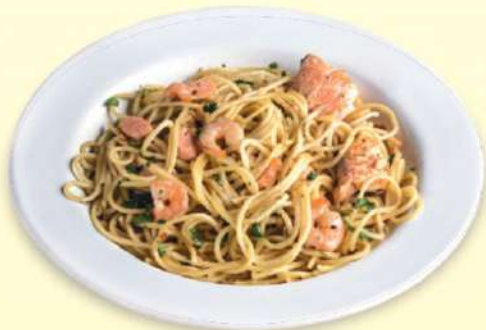
SPAGHETTI AL SALMÓN