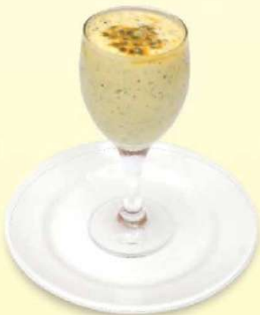
MOUSSE DE MBURUCUYÁ