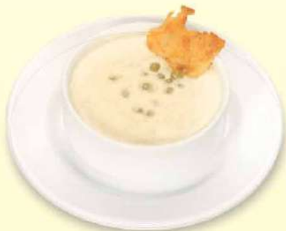
CONSOMÉ DE ARVEJAS