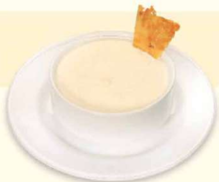
CONSOMÉ DE PALMITOS