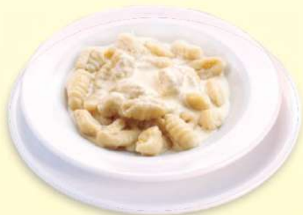
GNOCCHI A LA CREMA