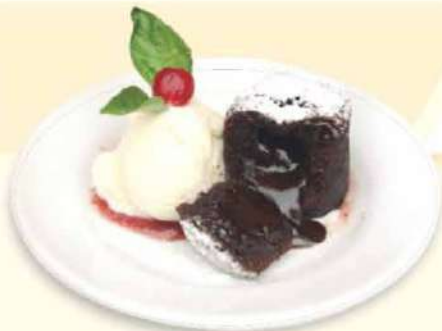
VOLCÁN DE CHOCOLATE