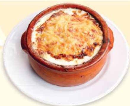
LASAGNA A LA BOLOGNESE