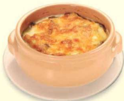
PICADA LOMITO AL CATUPIRY

Exquisitos trozos de lomito vacuno, con queso catupiry fundido.