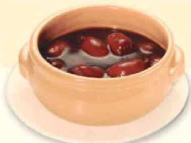
CHORICITOS AL VINO