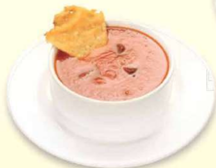
CONSOMÉ DE TOMATES