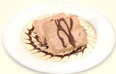
MARQUISE DE CHOCOLATE