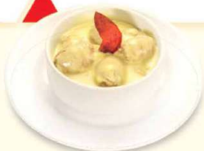
CHORICITOS A LA MOSTAZA