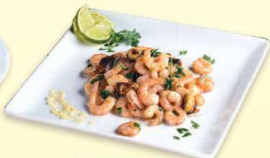
CAMARONES AL AJILLO