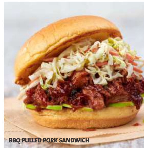
BBQ PULLED PORK SANDWICH

Papas fritas Sazonadas Cheese Fries con Bacon Vegetales frescos del día Twisted Mac & Cheese Aros de Cebolla Puré de Papas