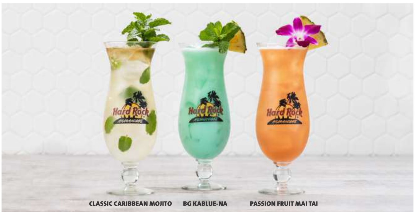
CLASSIC CARIBBEAN MOJITO