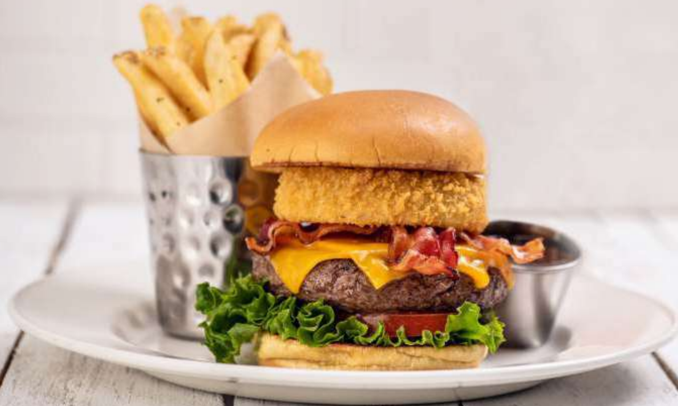
ORIGINAL LEGENDARY BURGER®

Al igual que las cuerdas de una guitarra deben estar perfectamente afinadas para tocar una gran melodía, cada detalle importa para las hamburguesas Legendary® de Hard Rock.