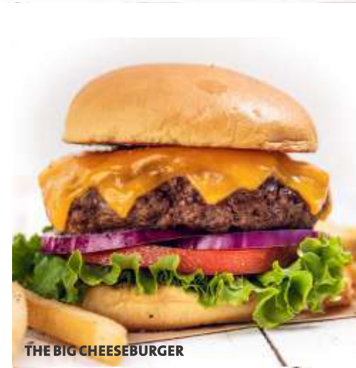
THE BIG CHEESEBURGER

(elige entre Strawberry Cheesecake o Cookies & Cream)