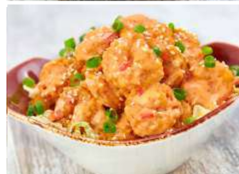
ONE NIGHT IN BANGKOK SPICY SHRIMP™