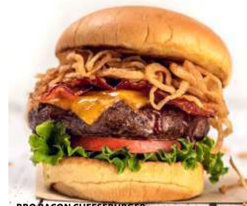
BBQ BACON CHEESEBURGER