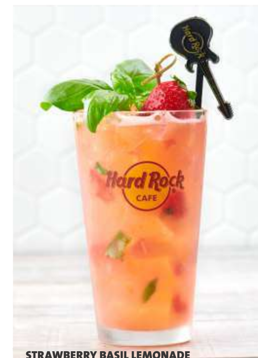
STRAWBERRY BASIL LEMONADE

Una mezcla tropical de mangos, frutilla, jugo de piña y jugo de naranja, mezcla agrídulce y un toque de soda lima - limón.