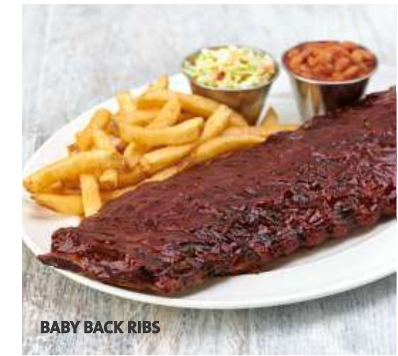
BABY BACK RIBS

Sazonada con nuestra exclusiva mezcla de especias, luego glaseada con nuestra salsa barbecue hecha en casa y asada a la perfección, servida con papas fritas sazonadas, ensalada coleslaw y frijoles estilo rancho.