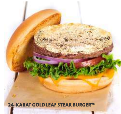
24-KARAT GOLD LEAF STEAK BURGER™