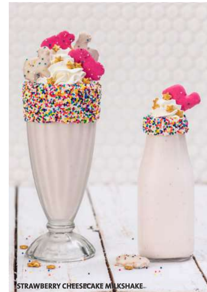
STRAWBERRY CHEESECAKE MILKSHAKE

Versión sin alcohol, servida en una exclusiva mini - milk jug.