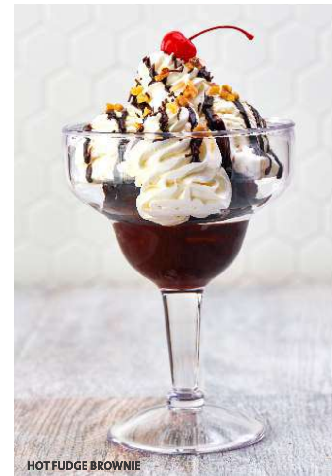
HOT FUDGE BROWNIE

Elige entre nuestros sabores de vainilla, chocolate dulce de leche o frutilla.