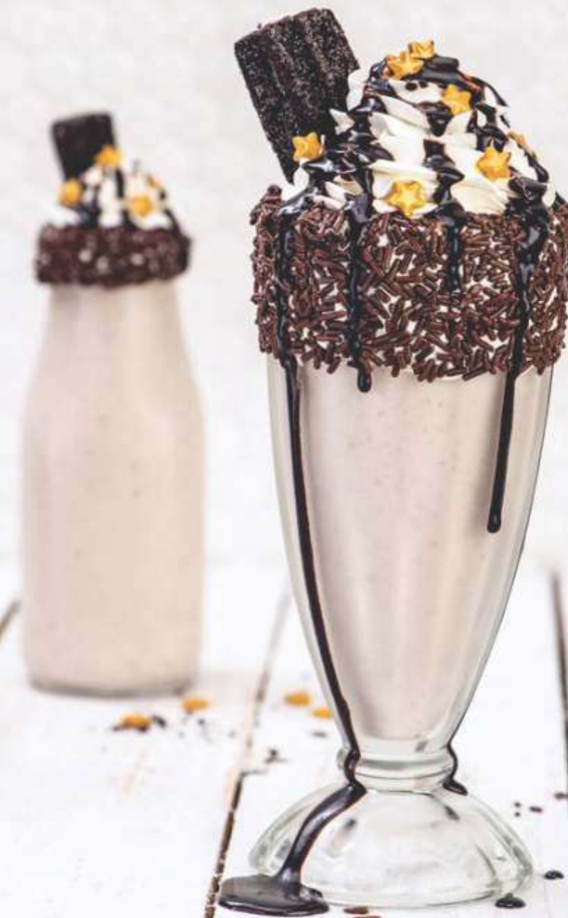
COOKIES & CREAM MILKSHAKE

De los Boozy Milkshakes hasta el Hot Fudge Brownie, nada habla mejor del rock n' roll que mimarte con algo dulce ¡Salud por los buenos postres!