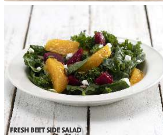
FRESH BEET SIDE SALAD