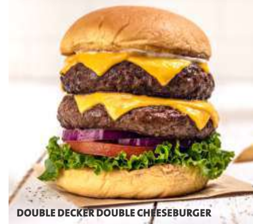
DOUBLE DECKER DOUBLE CHEESEBURGER