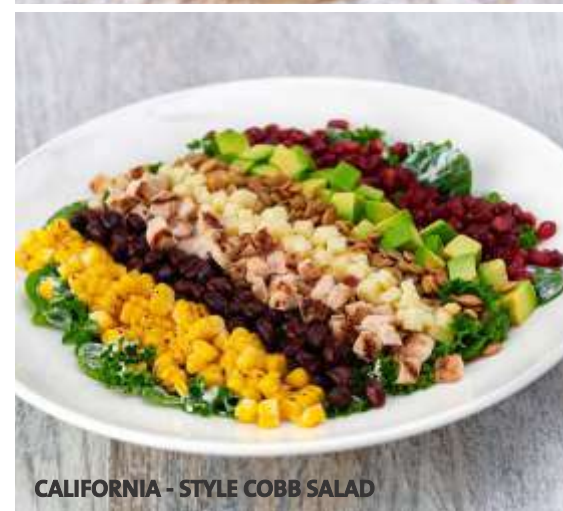
CALIFORNIA - STYLE COBB SALAD