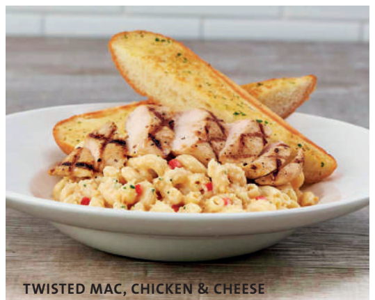
TWISTED MAC, CHICKEN & CHEESE

TROZOS DE POLLO FRESCO Y CRUJIENTE SERVIDOS CON PAPAS FRITAS SAZONADAS, MOSTAZA CON MIEL Y NUESTRA SALSA BARBACOA CASERA.* Gs.46.000