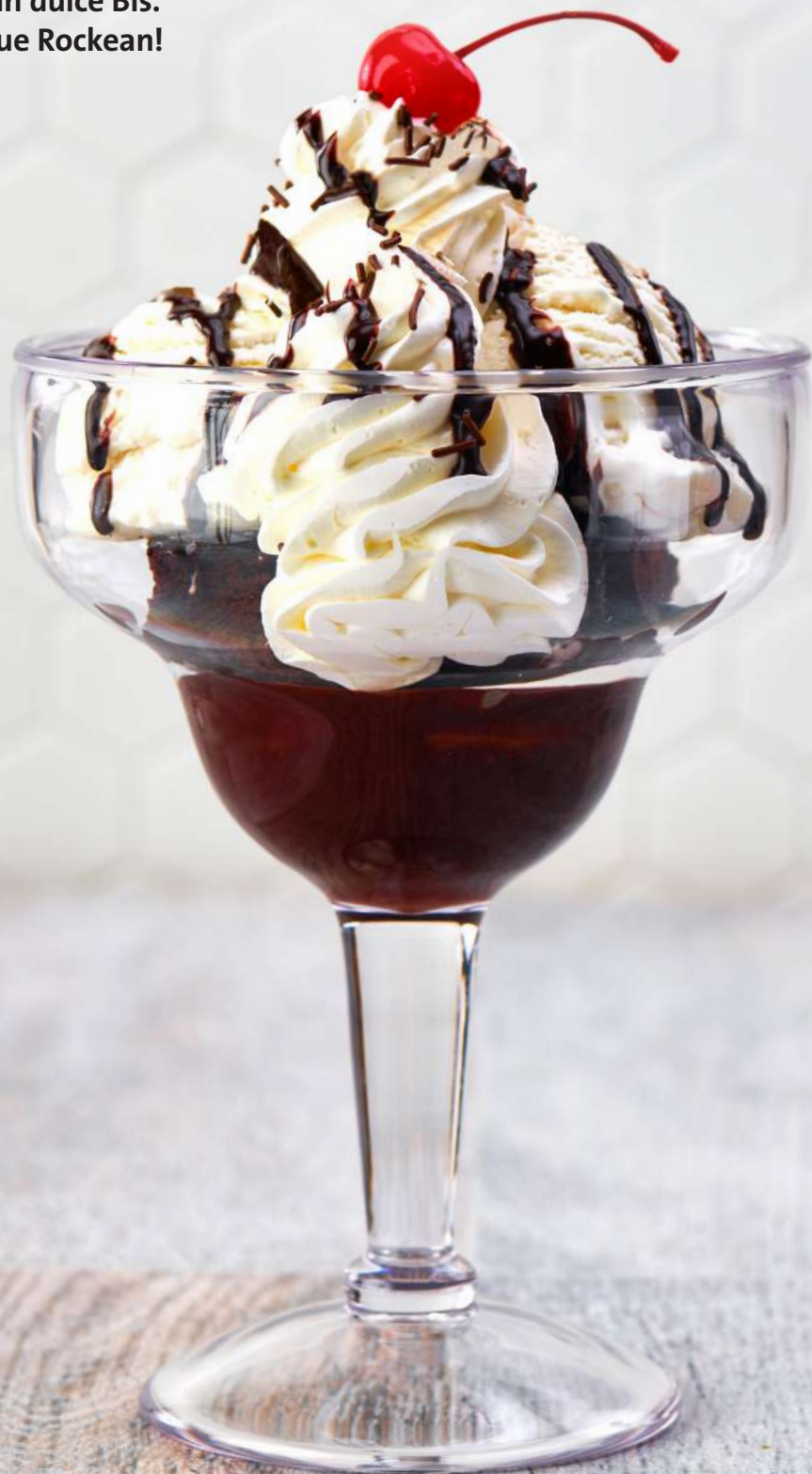
HOT FUDGE BROWNIE

Desde batidos hasta brownies con chocolate caliente, nada dice Rock n' Roll como un dulce Bis. ¡Salud por los postres que Rockean!