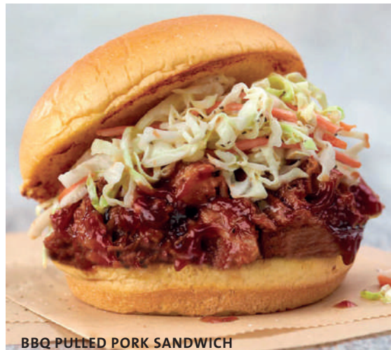
BBQ PULLED PORK SANDWICH

PECHUGA DE POLLO CRUJIENTE MARINADA EN BUTTERMILK CON LECHUGA, TOMATE, ADEREZO RANCH, SERVIDO EN PAN BRIOCHE TOSTADO. ¡CONDIMENTALO CON NUESTRA SALSA CLÁSICA DE BÚFALO A PEDIDO!* Gs.44.000