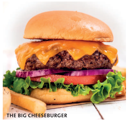
THE BIG CHEESEBURGER

DOS HAMBURGUESAS APILADAS, SAZONADAS Y SELLADAS, CON QUESO MONTERREY JACK, JALAPEÑOS EN ESCABECHE, LECHUGA, TOMATE Y MAYONESA PICANTE.* Gs.56.000