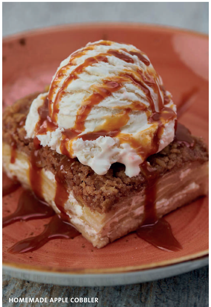
HOMEMADE APPLE COBLER

SU ELECCIÓN DE VAINILLA O CHOCOLATE MEZCLADO Y TERMINADO CON CREMA CHANTILLY.* Gs.22.000