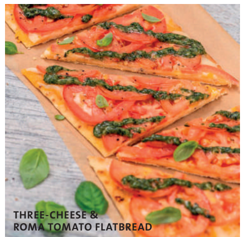
THREE-CHEESE & ROMA TOMATO FLATBREAD