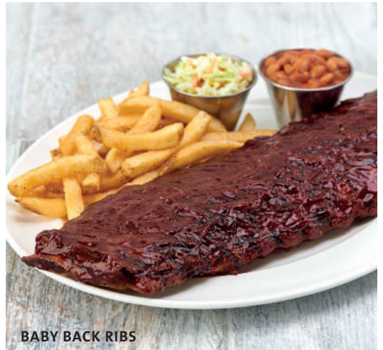
BABY BACK RIBS

SAZONADO CON NUESTRA EXCLUSIVA MEZCLA DE ESPECIAS, GLASEADO CON NUESTRA SALSA BARBACOA CASERA Y ASADA A LA PERFECCIÓN, SERVIDA CON PAPAS FRITAS SAZONADAS, ENSALADA DE COL Y FRIJOLES ESTILO RANCHERO.* Gs.90.000