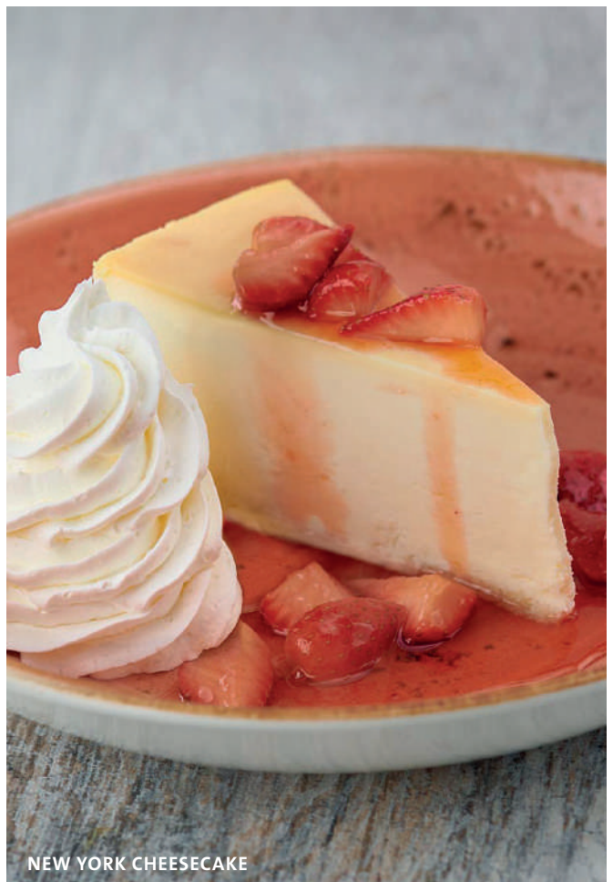
NEW YORK CHEESECAKE

Tenemos información sobre alergias para todo el menú, consulte con su servidor para más detalles. Si sufre de alergia alimentaria, asegúrese de que su servidor esté al tanto al momento del pedido. † Contiene nueces o semillas. * Estos artículos contienen (o pueden contener) ingredientes crudos o pocos cocidos. El consumo de hamburguesas, carnes, aves, mariscos, crustáceos o huevos crudos o poco cocidos puede aumentar el riesgo de enfermedades transmitidas por los alimentos, especialmente si tiene ciertas afecciones médicas. Se utilizan 2000 calorías al día para el asesoramiento nutricional general, pero las necesidades calóricas podrían variar.