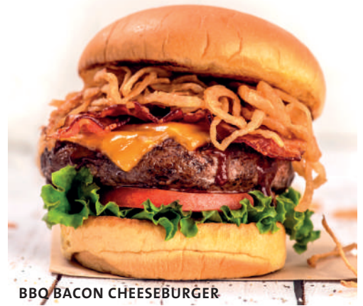
BBQ BACON CHEESEBURGER