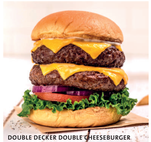
DOUBLE DECKER DOUBLE CHEESEBURGER