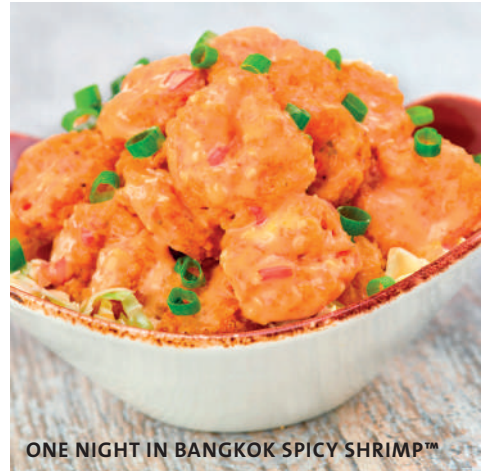
ONE NIGHT IN BANGKOK SPICY SHRIMP™