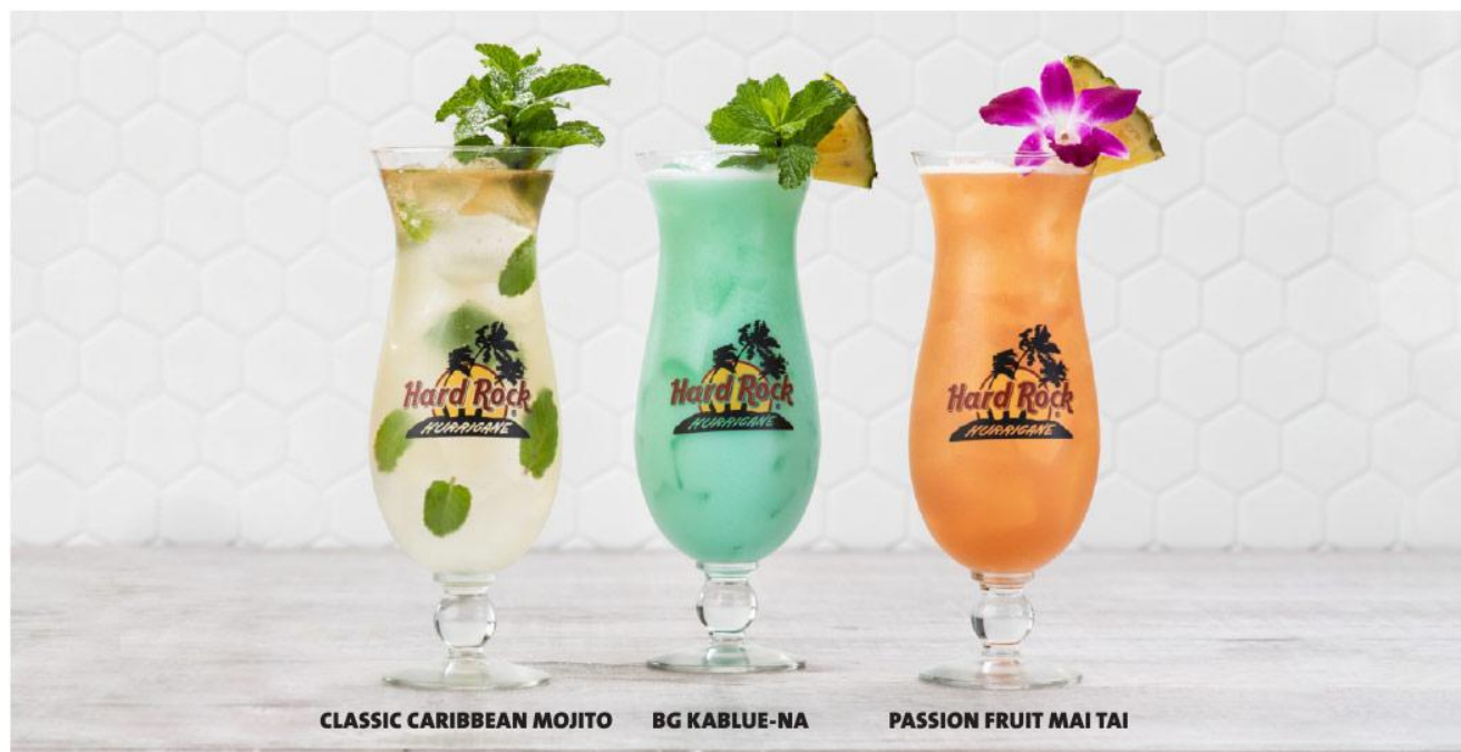
CLASSIC CARIBBEAN MOJITO