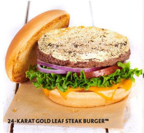
24-KARAT GOLD LEAF STEAK BURGER™