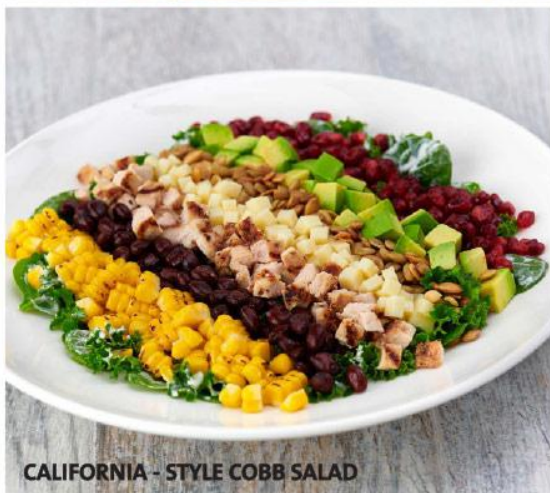
CALIFORNIA - STYLE COBB SALAD