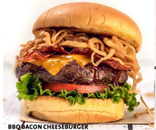
BBQ BACON CHEESEBURGER