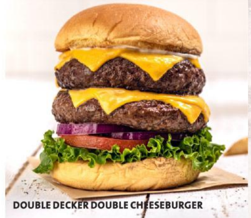
DOUBLE DECKER DOUBLE CHEESEBURGER

Contamos con información sobre alergias sobre todos los productos del menú, comuníquese con su mesero para obtener más detalles. Si es alérgico a algún alimento, asegúrese de que su mesero este informado al momento de hacer su pedido. † Contiene nueces o semillas. * Este producto contiene (o puede contener) ingredientes crudos o poco cocidos. El consumo de carnes, hamburguesas, pollo, mariscos o huevos crudos o poco cocidos pueden aumentar el riesgo de intoxicación por alimentos, especialmente si usted tiene condiciones médicas particulares.