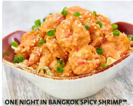
ONE NIGHT IN BANGKOK SPICY SHRIMP™