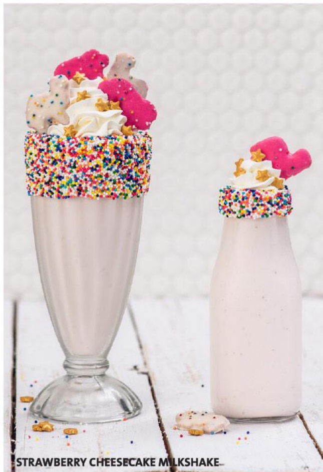
STRAWBERRY CHEESECAKE MILKSHAKE

Vodka Absolut Vainilla, helado de vainilla, mezclado con los sabores de cheesecake de frutilla, crema chantilly con chocolate blanco y galletas de animales glaseadas. 30.000 Gs. Versión sin alcohol, servida en una exclusiva mini - milk jug.