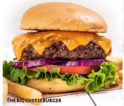
THE BIG CHEESEBURGER