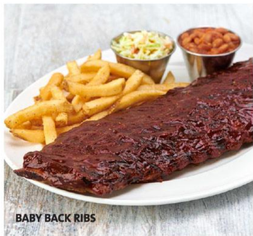
BABY BACK RIBS

Sazonada con nuestra exclusiva mezcla de especias, luego glaseada con nuestra salsa barbecue hecha en casa y asada a la perfección, servida con papas fritas sazonadas, ensalada coleslaw y frijoles estilo ranchero. 80.000 Gs.