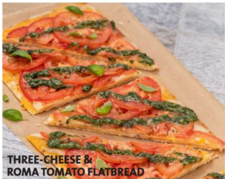
THREE-CHEESE & ROMA TOMATO FLATBREAD