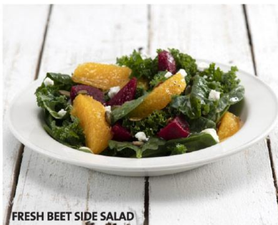
FRESH BEET SIDE SALAD