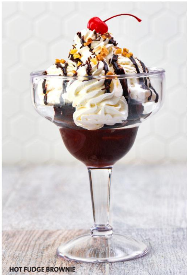
HOT FUDGE BROWNIE

Elige entre nuestros sabores de vainilla, chocolate dulce de leche o frutilla. 18.000 Gs.