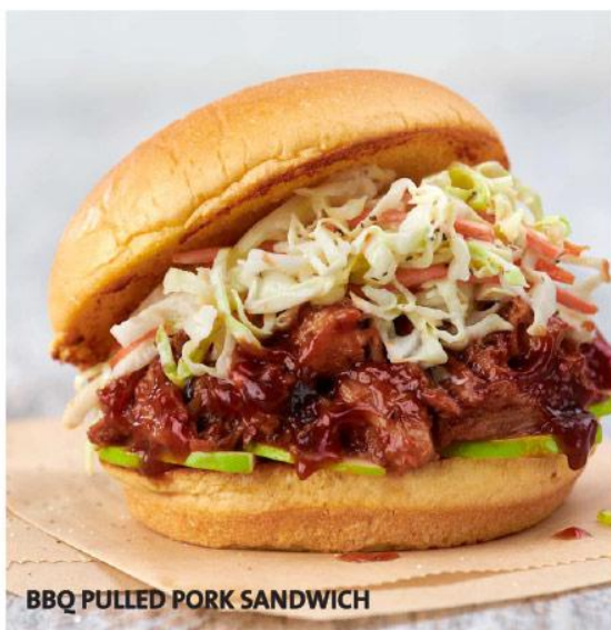
BBQ PULLED PORK SANDWICH

8 oz de pollo a la parrilla, servida con tiras de panceta ahumada, crujientes hojas de lechuga y tomate maduro, servido en un pan de molde tostado mayonesa. 40.000 Gs.