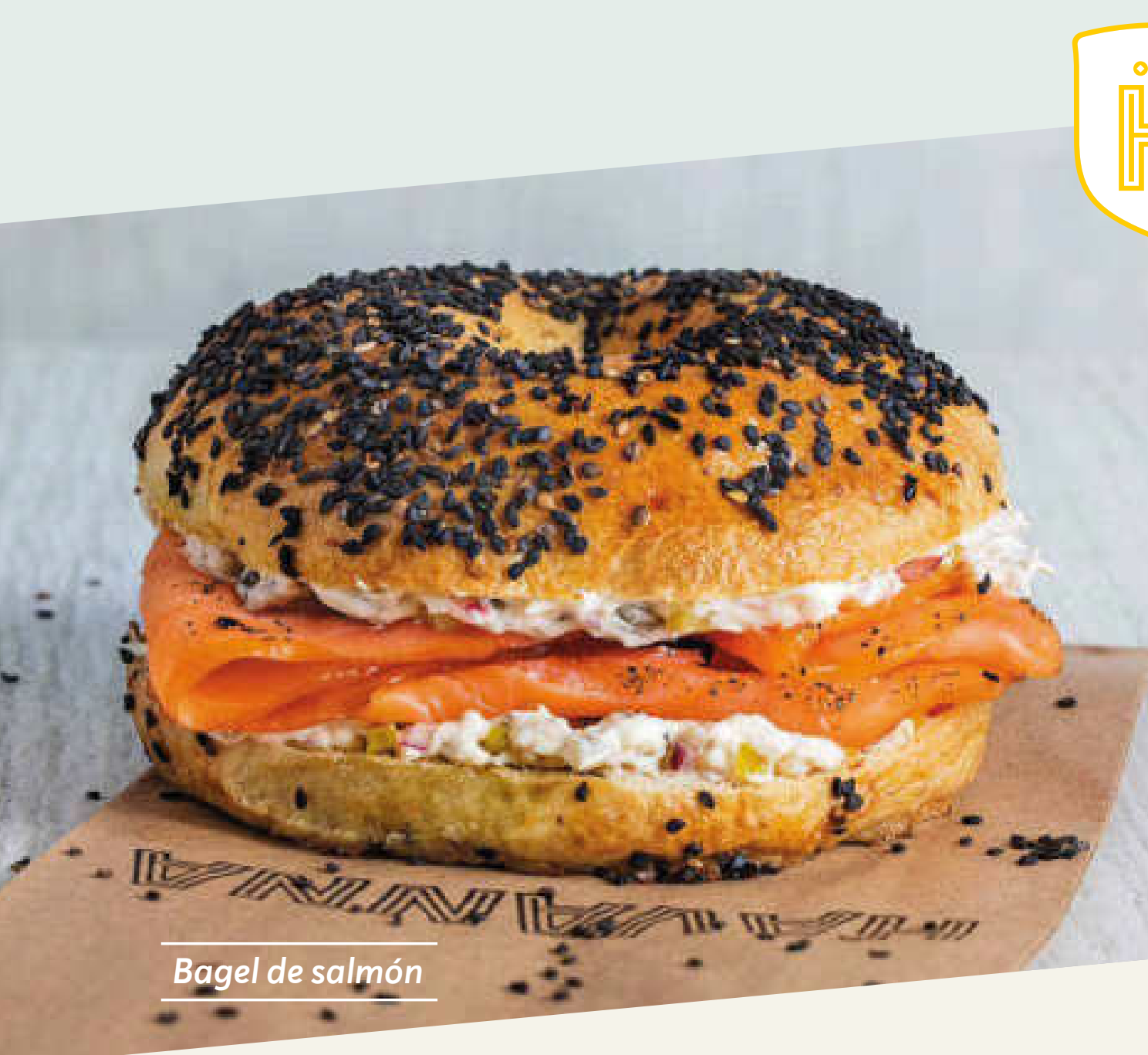
Bagel de salmón