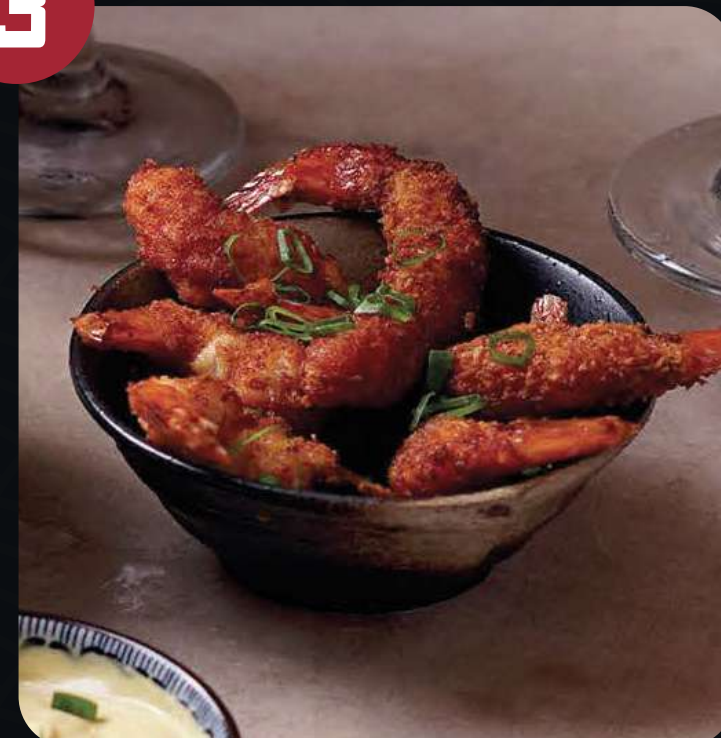
LANGOSTINOS APANADOS (4 UNID).