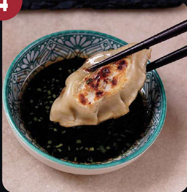
GYOZAS (5 UNID).