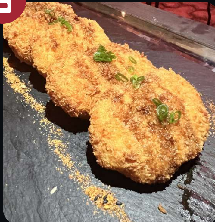
CROQUETAS DE SALMÓN (4 UNID).