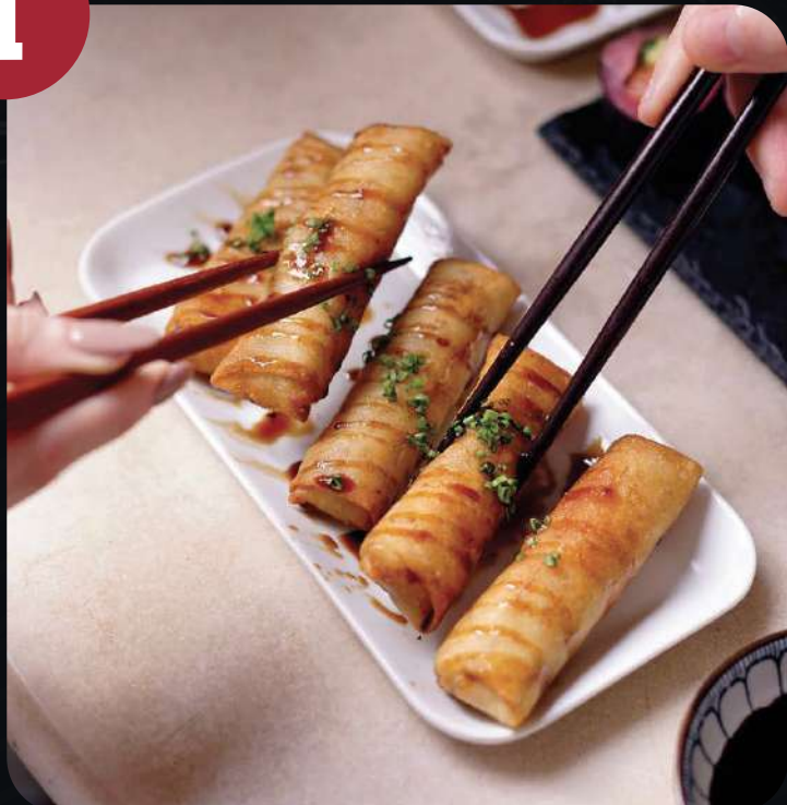
SPRING ROLLS (5 UNID).