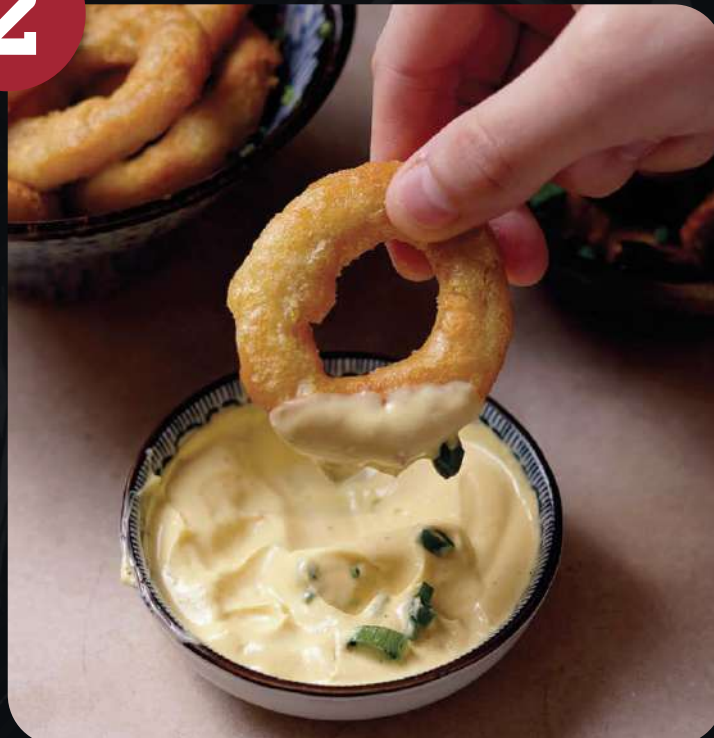
ANILLAS DE CALAMAR (7 UNID).