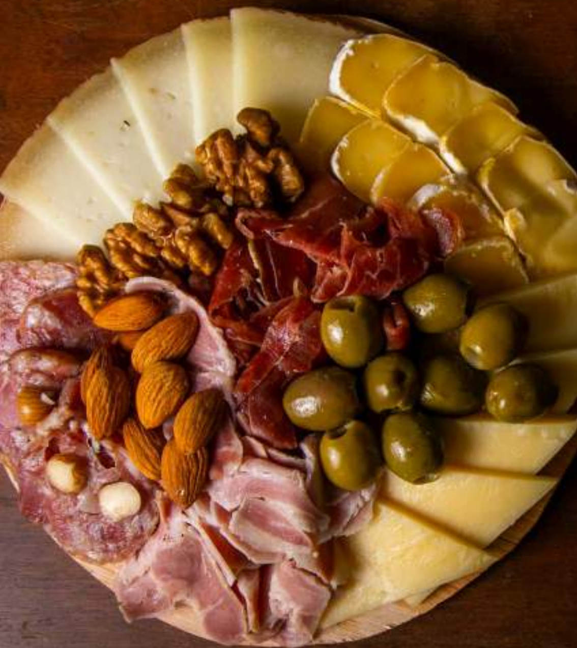
OPCIÓN 3 TABLA La Quesería