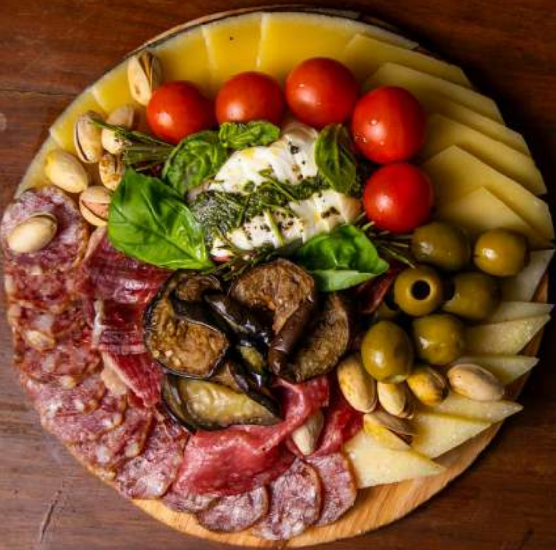
OPCIÓN 3 TABLA Italiana