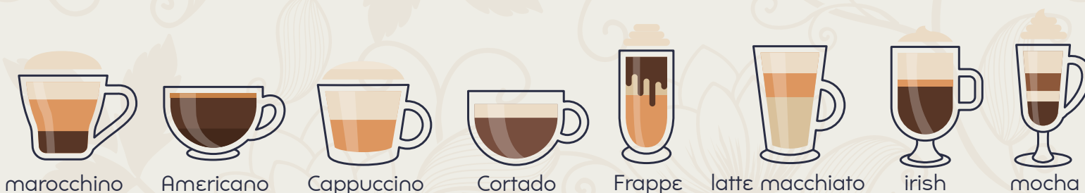
marocchino Americano Cappuccino Cortado Frappe latte macchiato irish mocha