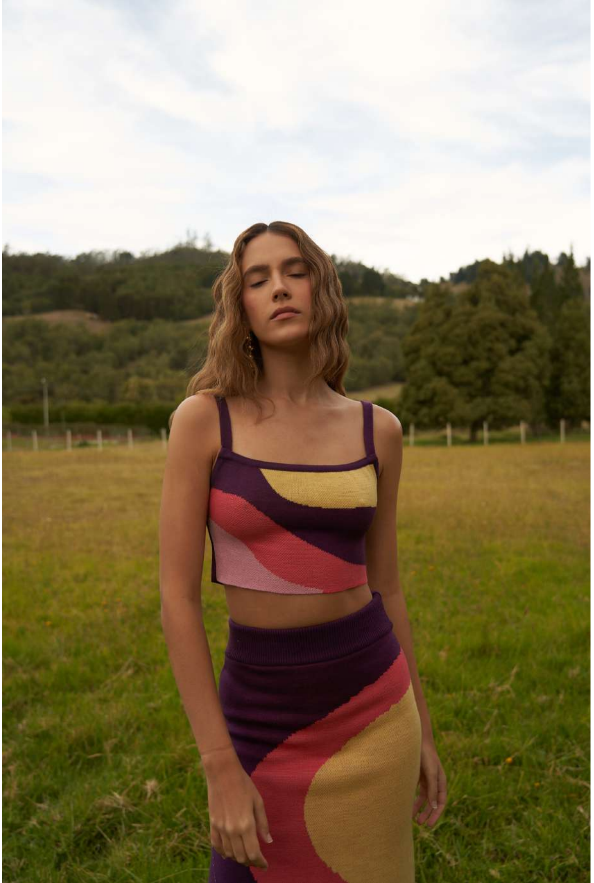
Top DANIQUE - SUNRISE $220.000 COP S, M y L