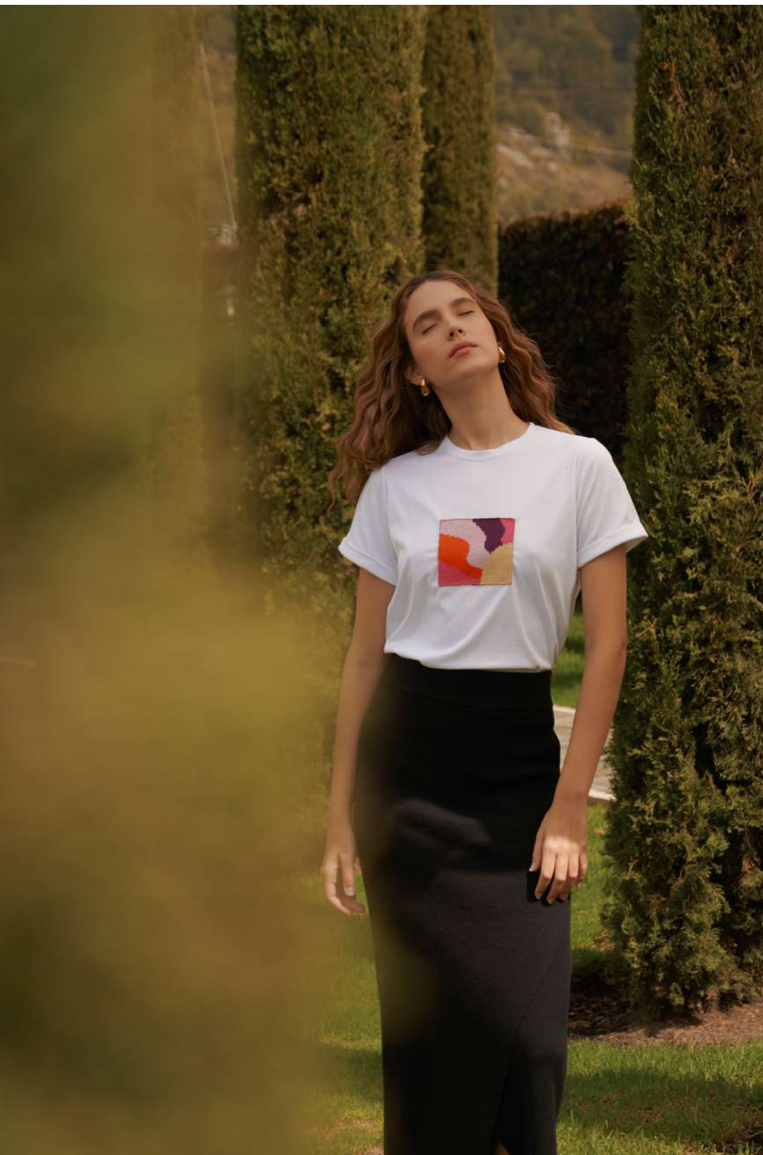
Camiseta ZARIA $180.000 COP S, M y L