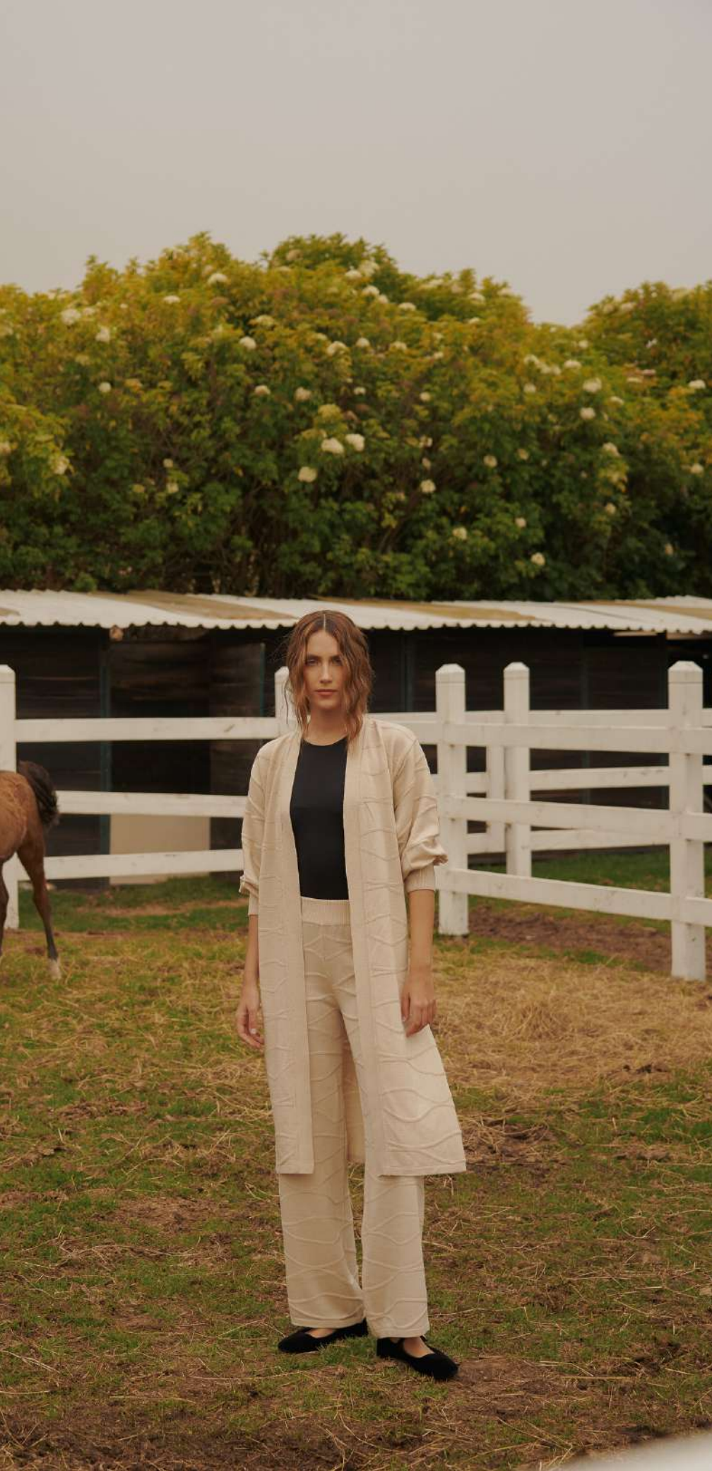
Pantalón ZORA Warm Beige $390.000 COP S, M y L