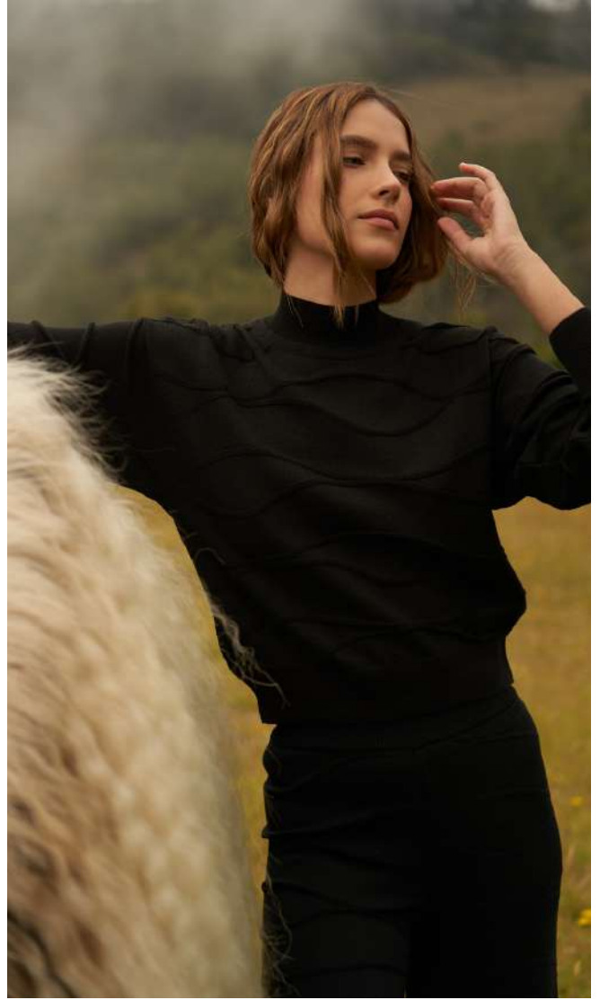
T-NECK CHIARA – Waves in Black