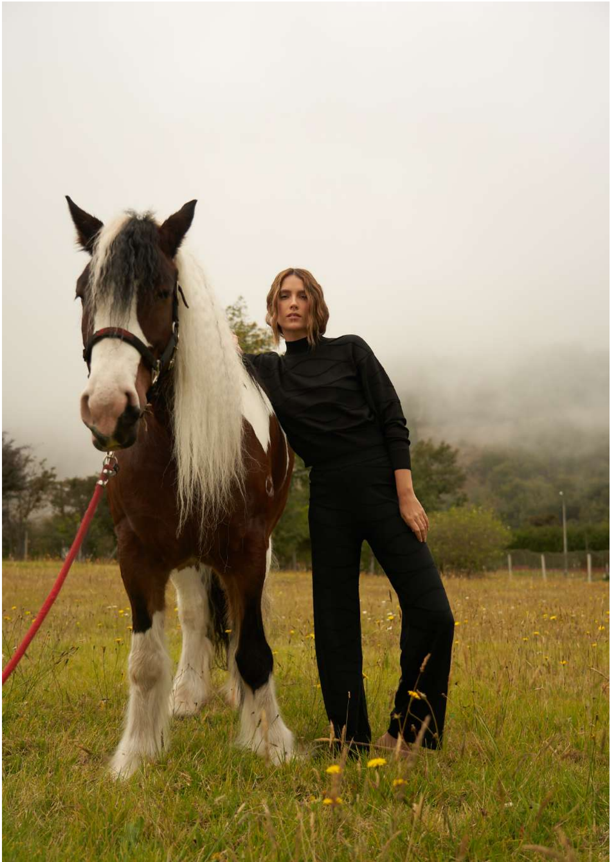
Pantalón ZORA – Waves in Black