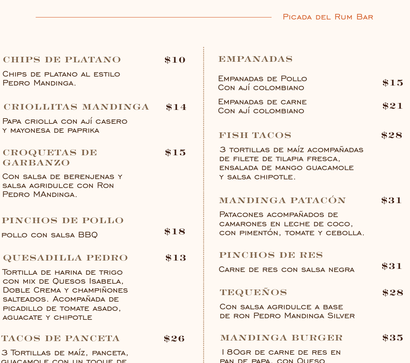
PICADA DEL RUM BAR