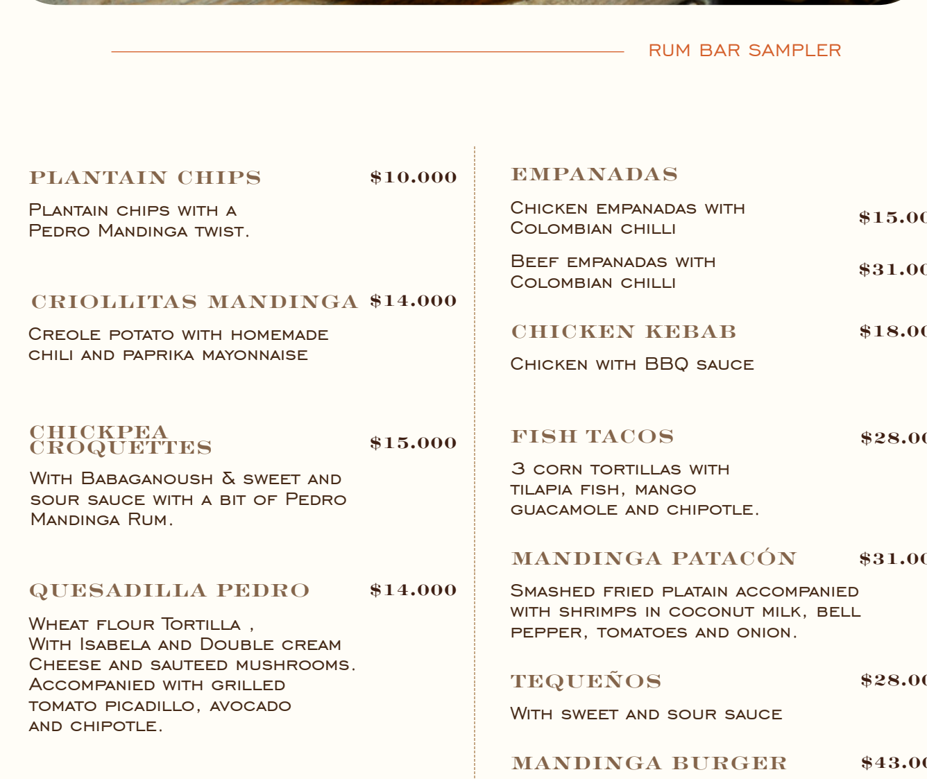
RUM BAR SAMPLER