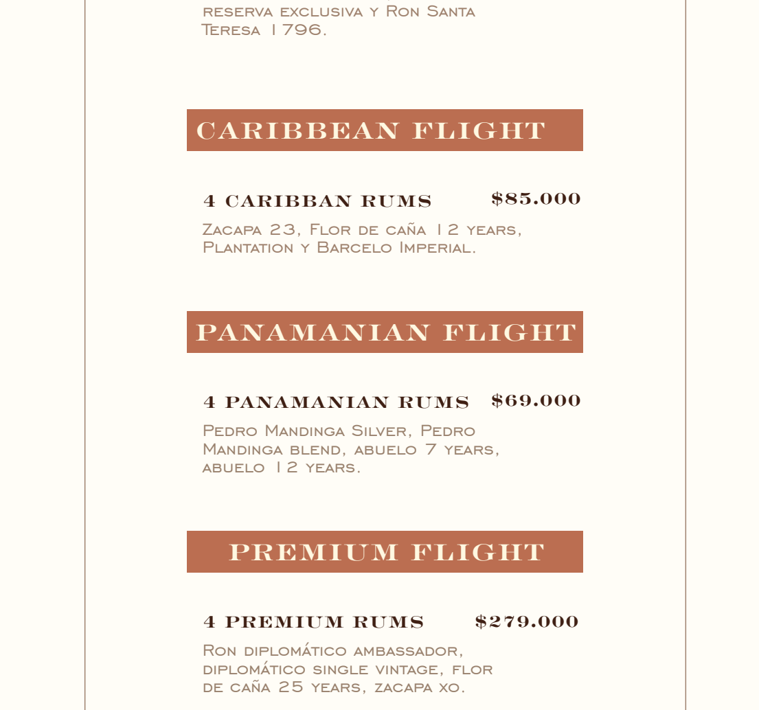
PEDRO MANDINGA BLEND