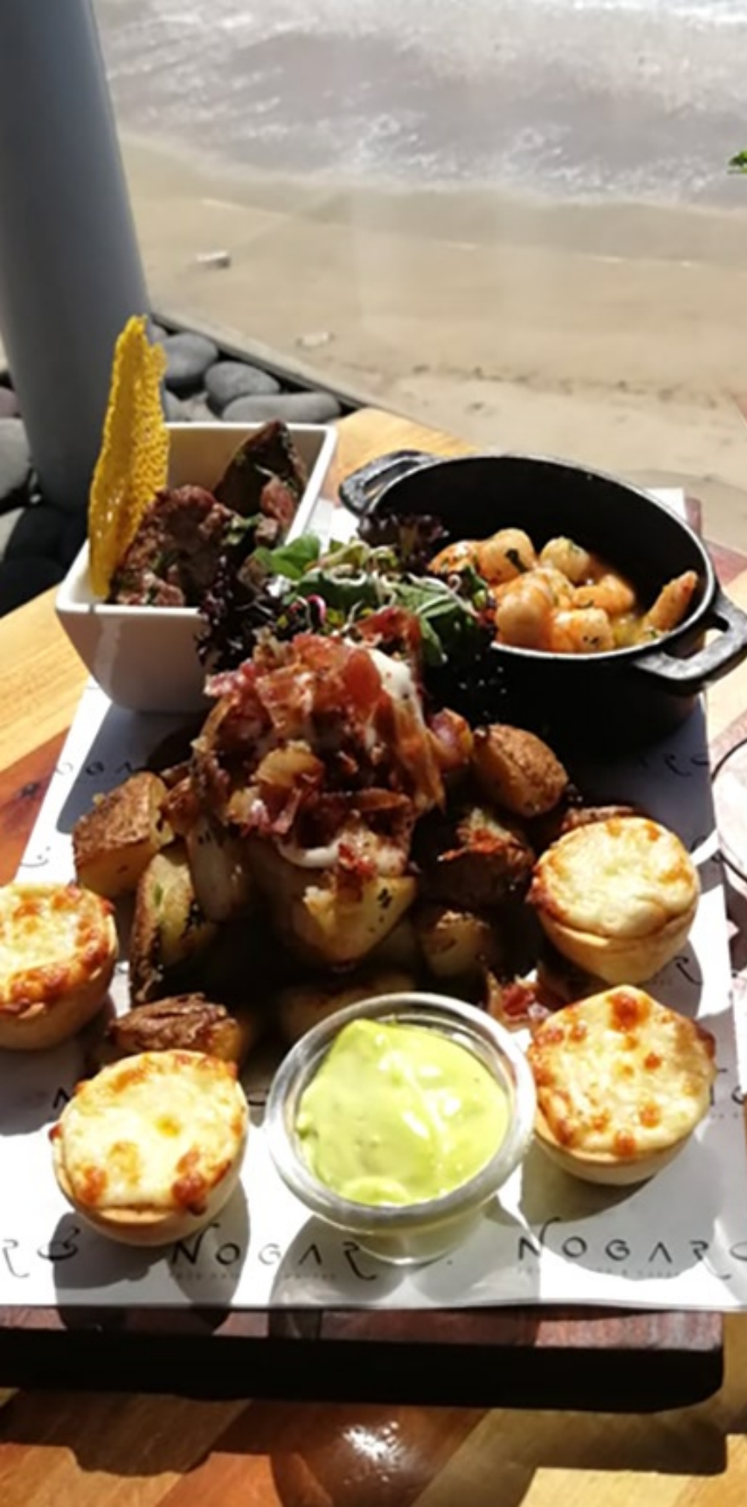
Tabla Mar y Tierra PARA DOS PERSONAS