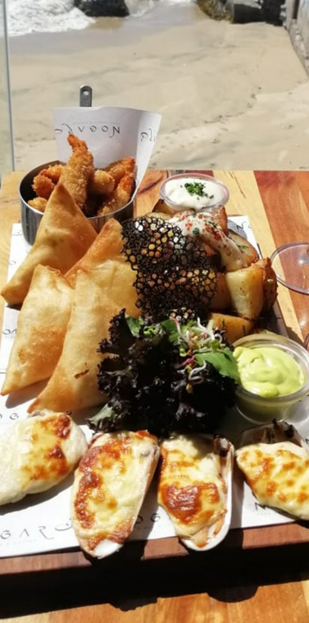
Tabla Mar Nogaró PARA DOS PERSONAS