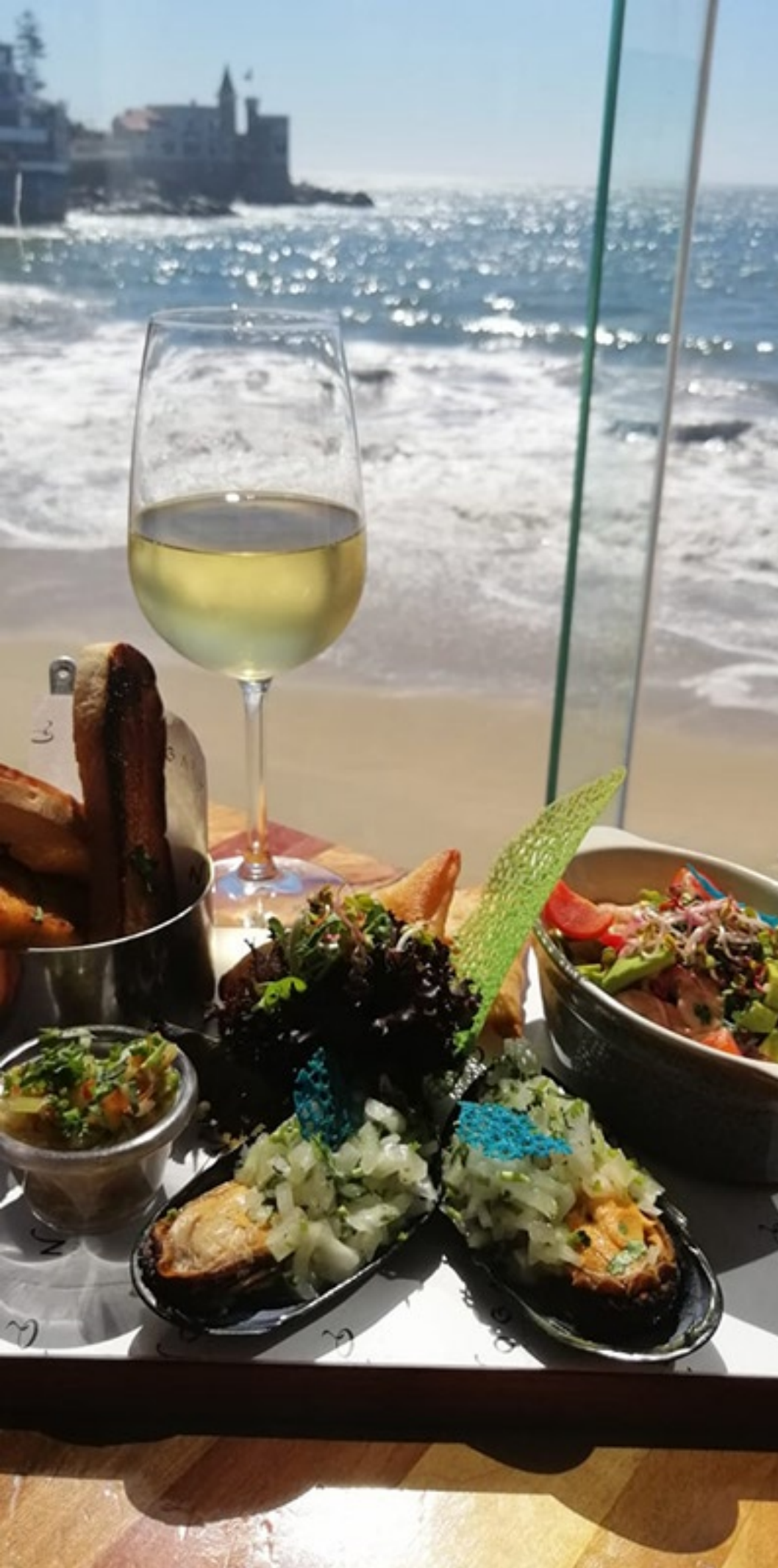
Tabla Pacífico PARA DOS PERSONAS