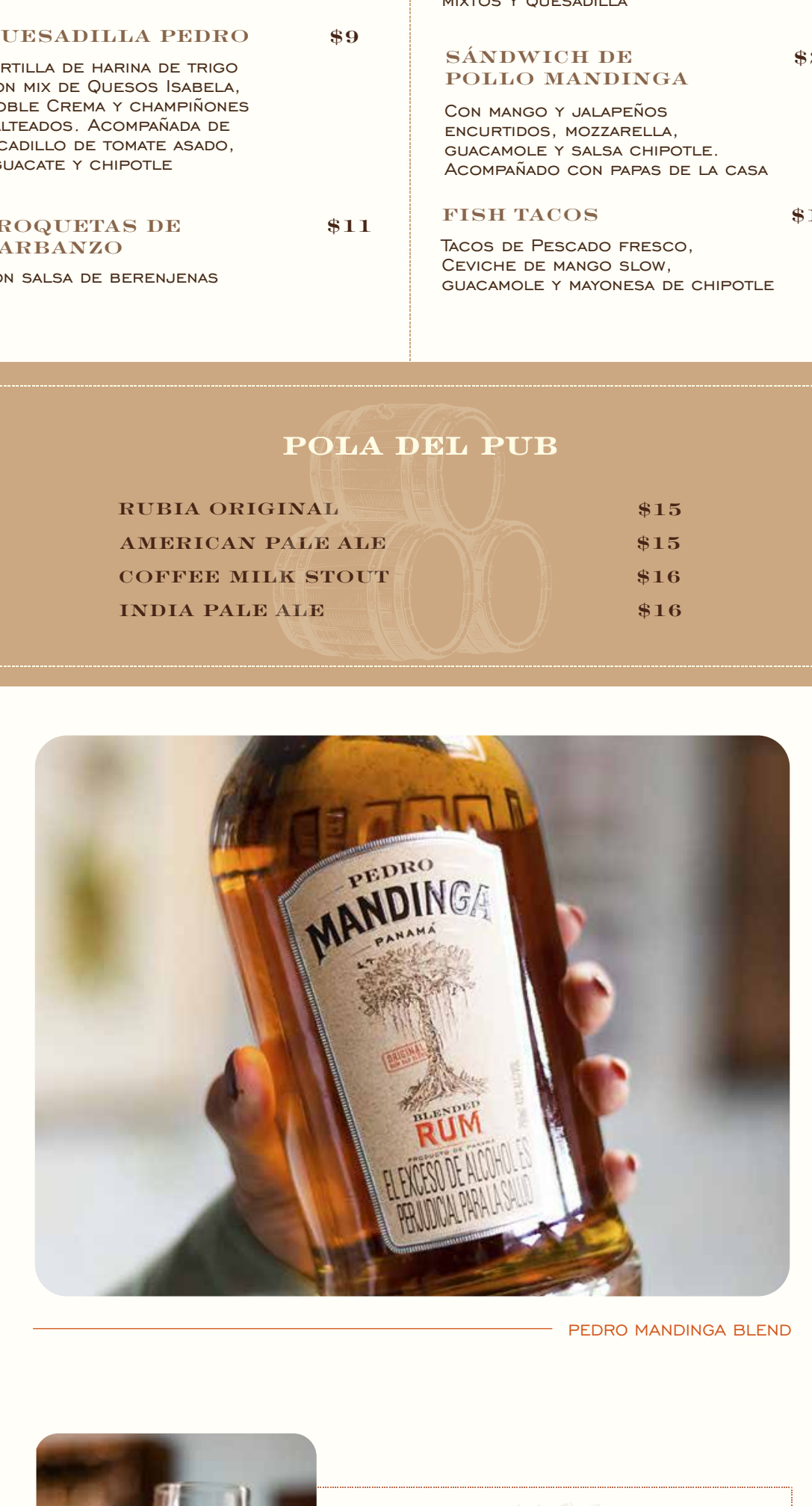
PICADA DEL RUM BAR