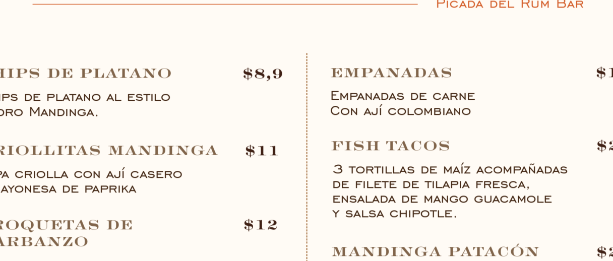
PICADA DEL RUM BAR