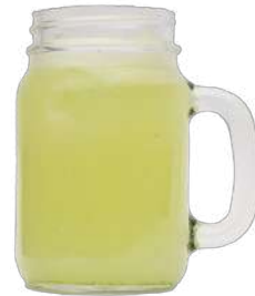
LIMONADA $ 5.000