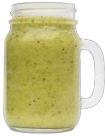
DETOX KIWI $ 7.000