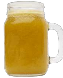
LULO FRAPPE $ 6.000