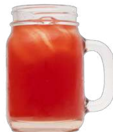
ICE TEA POKE $ 5.000