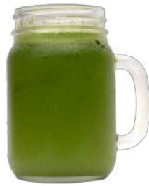
LIMONADA HIERBABUENA $ 5.000