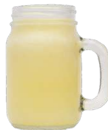
LIMONADA DE MANGO BICHE $ 6.000