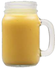
VITAMIN MANGO $ 7.000