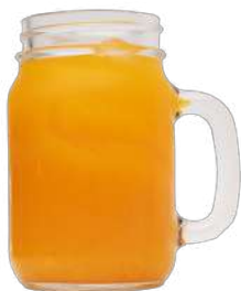
JUGO DE MANDARINA $ 6.000