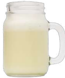
LIMONADA DE COCO $ 7.000