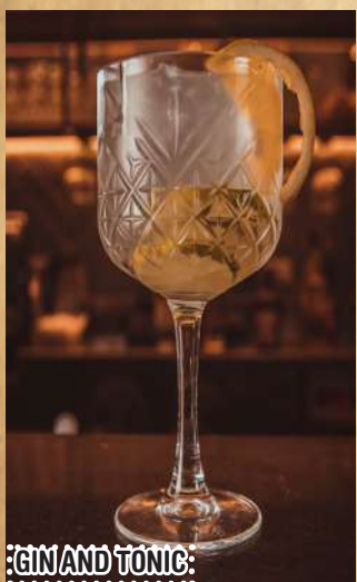
GIN AND TONIC