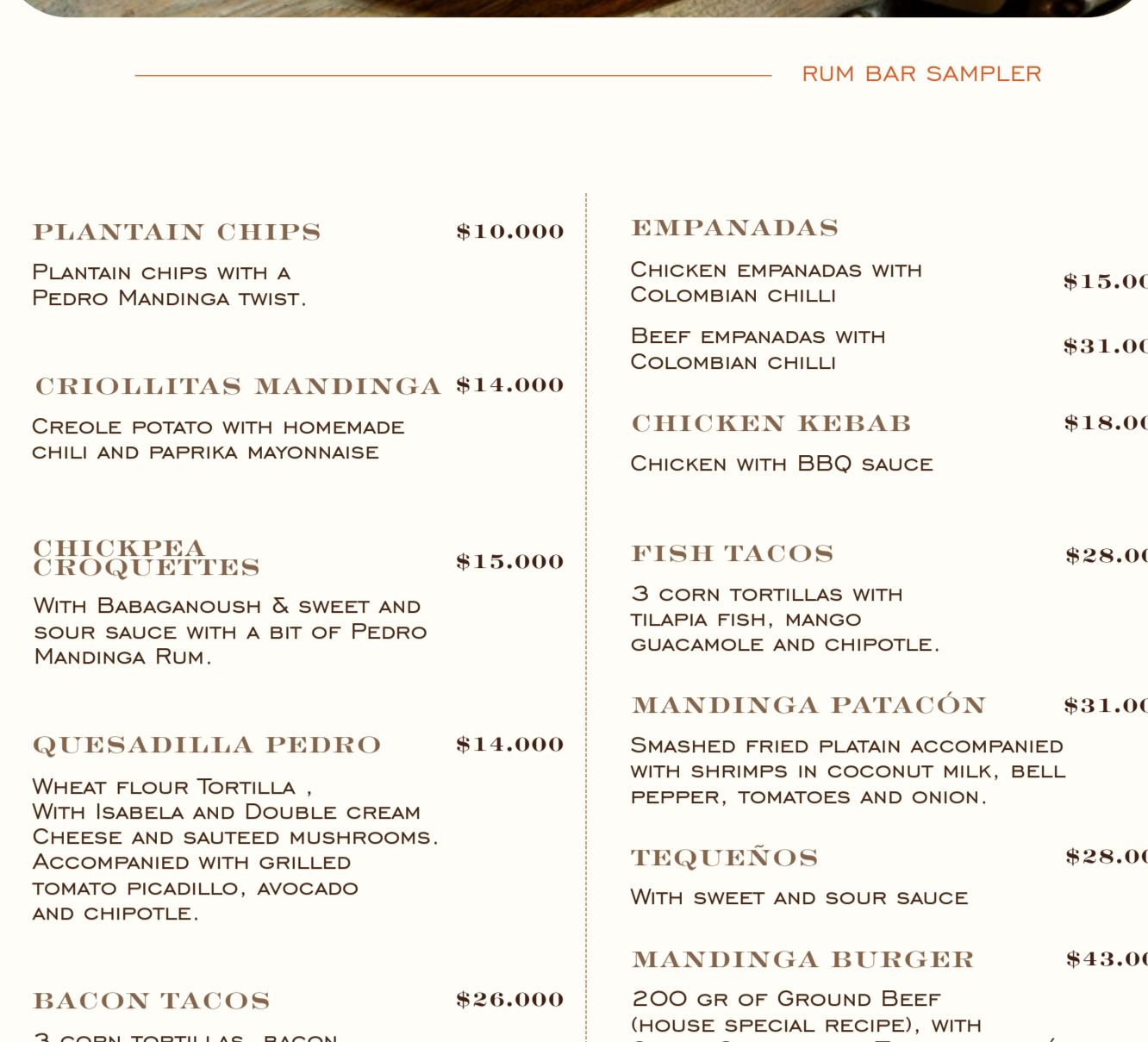
RUM BAR SAMPLER