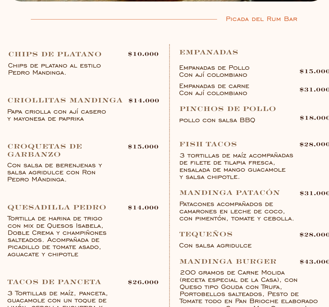
PICADA DEL RUM BAR