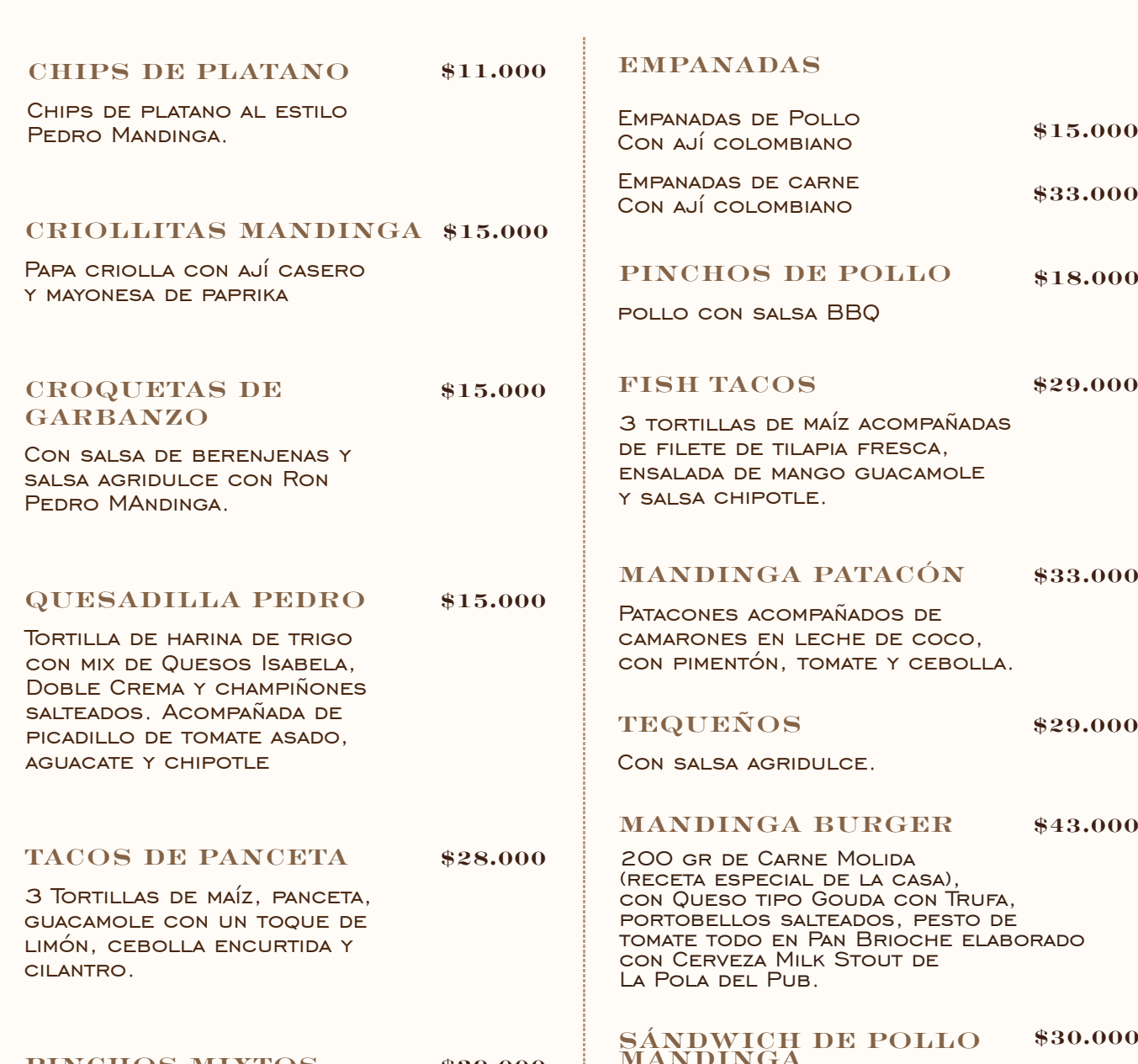
PICADA DEL RUM BAR