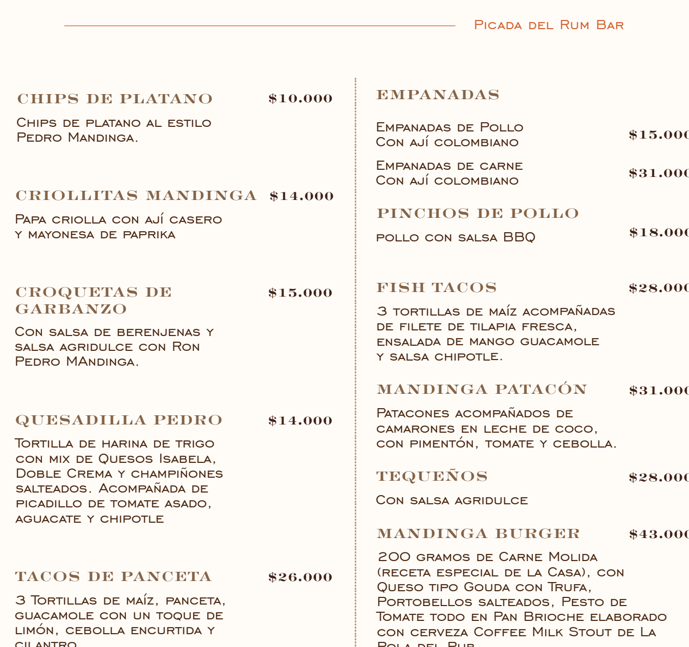
PICADA DEL RUM BAR