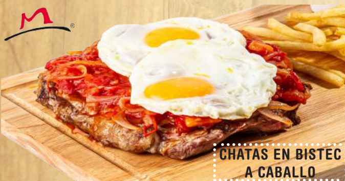
CHATAS EN BISTEC A CABALLO