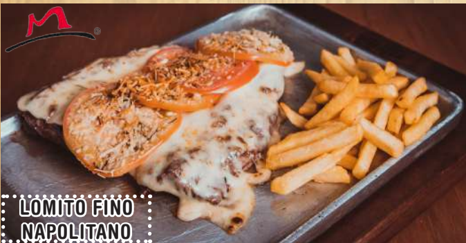
LOMITO FINO NAPOLITANO