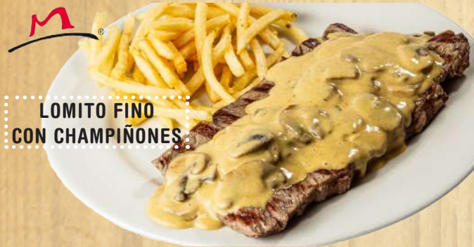
LOMITO FINO CON CHAMPIÑONES