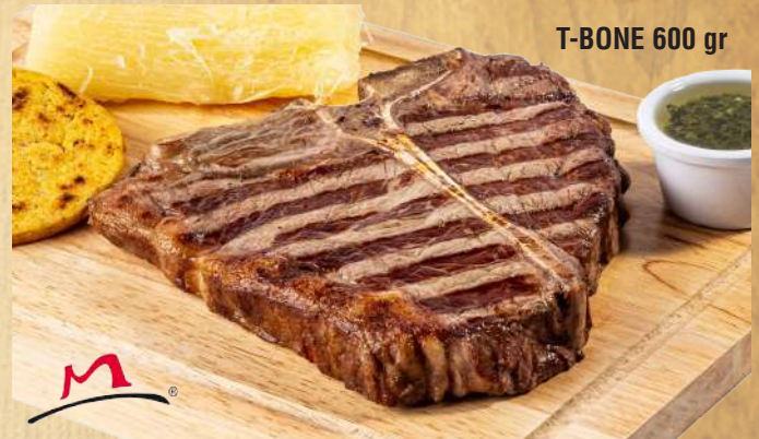
T-BONE 600 gr