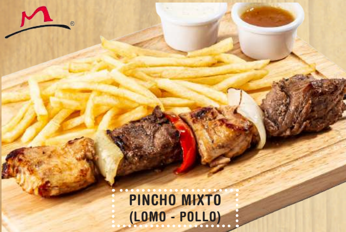
PINCHO MIXTO (LOMO - POLLO)