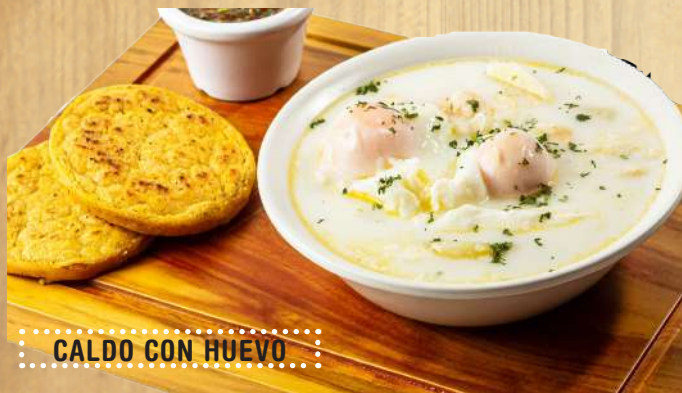
CALDO CON HUEVO

CALDO CON HUEVO (Con Arepa Santandereana) $17.000