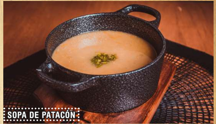
SOPA DE PATAcón