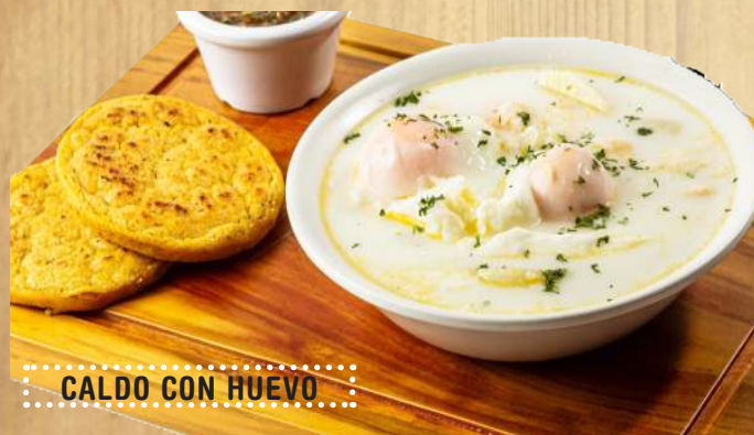
CALDO CON HUEVO

CALDO CON HUEVO (Con Arepa Santandereana) $17.000