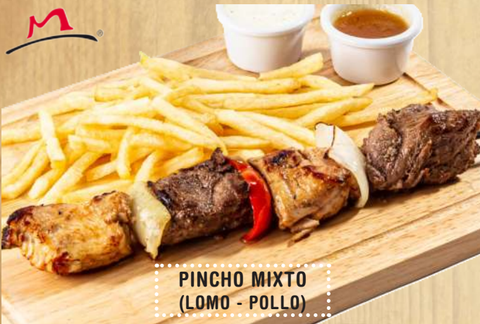
PINCHO MIXTO (LOMO - POLLO)