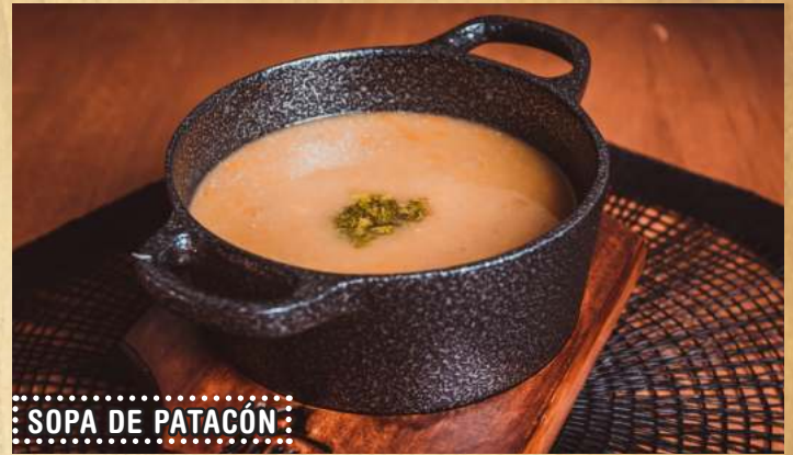
SOPA DE PATAcón