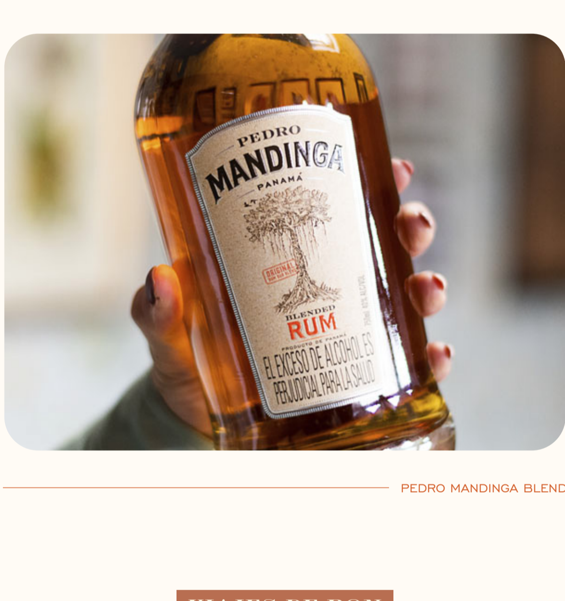
PEDRO MANDINGA BLEND