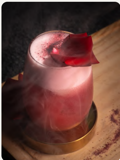
ROSA DE GUADALUPE , Gin infusionado en hibiscus, jugo de pomelo, jugo de limon, syrup de rosas, aperol y top de rose lemonade. $8.990