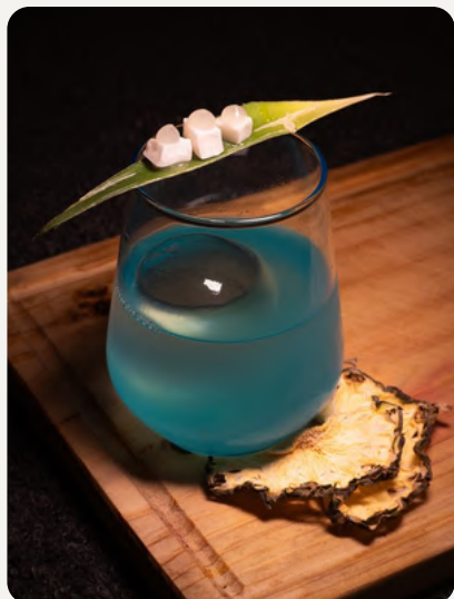
COCO BONGO , ron infusionado en aceite de coco, jugo de piña clarificado, syrup simple y mezcal. $8.990

ESPECIALES QUE SOLO TIENES EN NUESTRA CASA