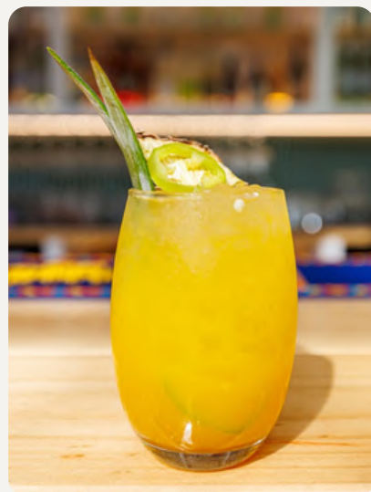
MEXICAN MULE , Mezcal 400 conejos, syrup de piña asada, limón, mango, jalapeños y top de ginger beer. $8.990