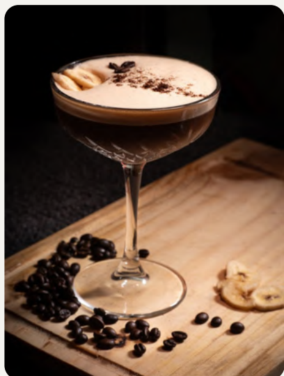
3 TESOROS , Ron santa teresa, cafe expresso, puro de platano y licor de cafe. $8.990