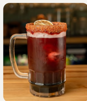
JAMAICACHELA , Jamaica, limón, borde de chamoy tajin decorada con naranja deshidratada. $7.990