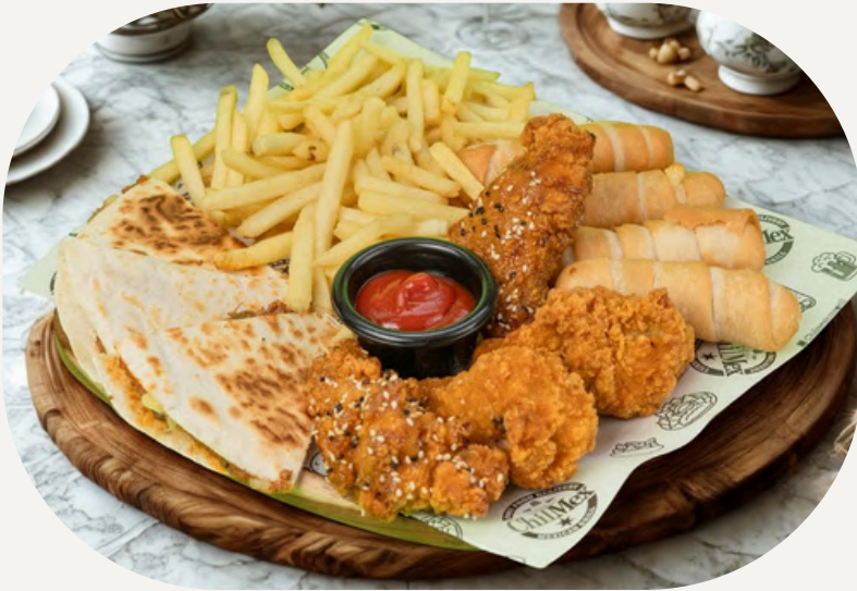
TABLA RANCHERA , quesadillas de chilis carne, alitas, tequeños, papas fritas acompañada con ketchup. $22.990

ALITAS , 6 crujientes alitas de pollo acompañadas con un aderezo. $9.990