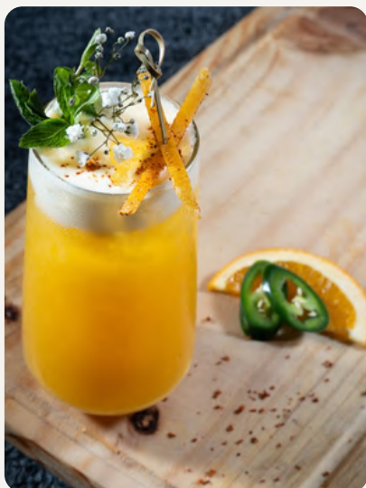
ENCHILADO , Tequila Patrón Silver, licor de mango habanero, mix tropical (maracuyá, naranja, limón) y top de soda de mandarina. $8.990