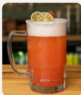
COZUMEL CORONA , Syrup Jamaica-Frutilla, limon, corona, decorada con limon y romero. $7.990