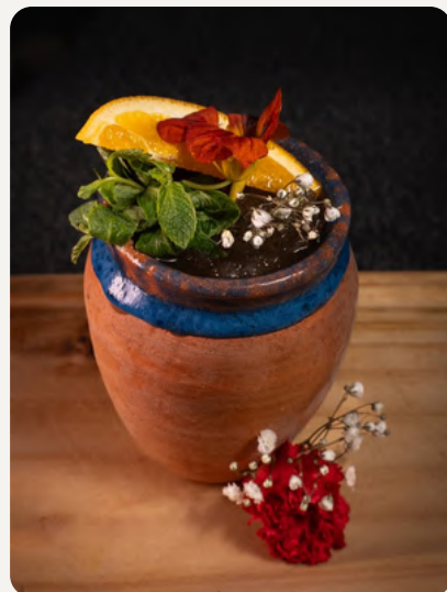
CANTARITO , tequila, mix citrico (pomelo, limon, naranja) syrup de tamarindo y soda de mandarina. $8.990