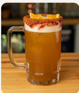
APASIONADA , Maracuyá, salsa inglesa, tabasco, tajin, limon, cerveza, bórde de chamoy tajin. $7.990