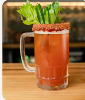
LA MEXICANA, Clamato, limon, inglesa, tajin, Tabasco, cerveza y borde de chamoy tajin. $7.990