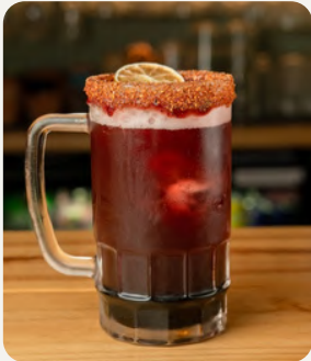
JAMAICACHELA, Jamaica, limón, borde de chamoy tajin decorado con naranja deshidratada. $7.990