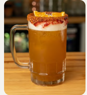
LA APASIONADA, Maracuyá, salsa inglesa, tabasco, tajin, limon, cerveza, borde de chamoy tajin. $7.990