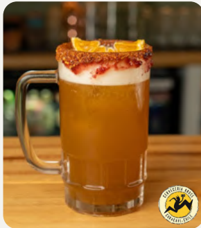
KROSS TROPICAL, Mix citrico de (Maracuya, limon y pomelo) borde chamoy con tajin $7.990