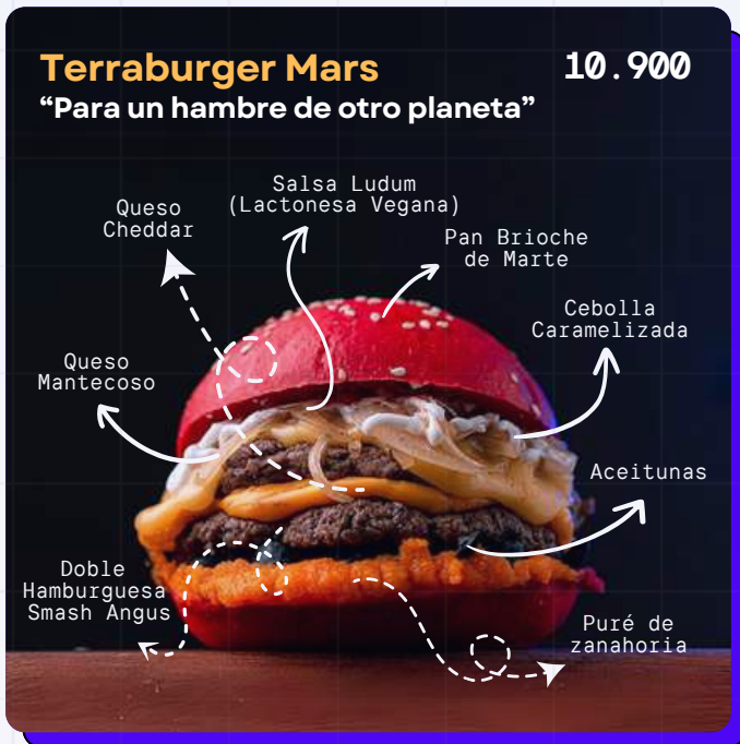
Smash Angus Burger, Cheddar and buttery cheese, sweet potato, caramelized onion, olives, mashed carrot, Ludum sauce