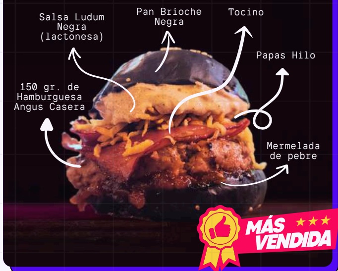
Bacon, black Ludum sauce, potatoes thread, pebre jam