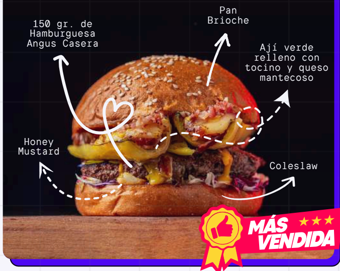
Coleslaw, green pepper filled with bacon and buttery cheese, honey mustard