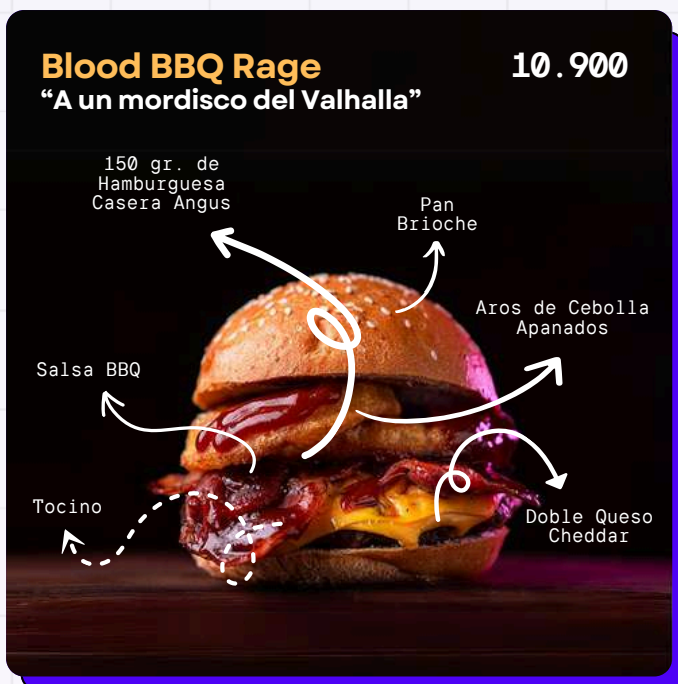
Bacon, double cheese cheddar, crispy onion rings, sauce Blood rage (BBQ whiskey)