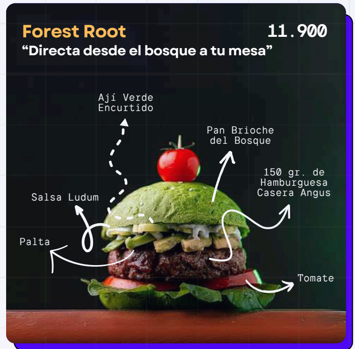
Avocado, arugula, pickled green chili, Ludum sauce