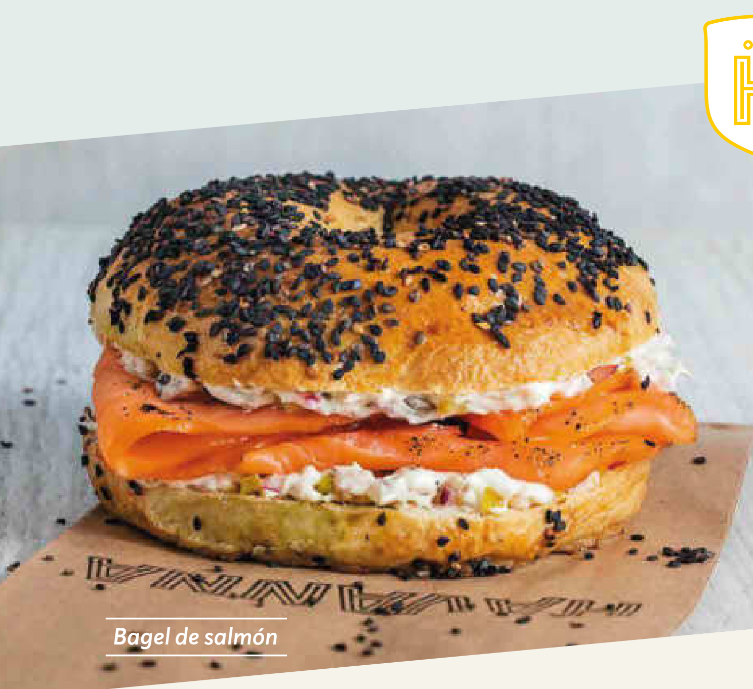
Bagel de salmón