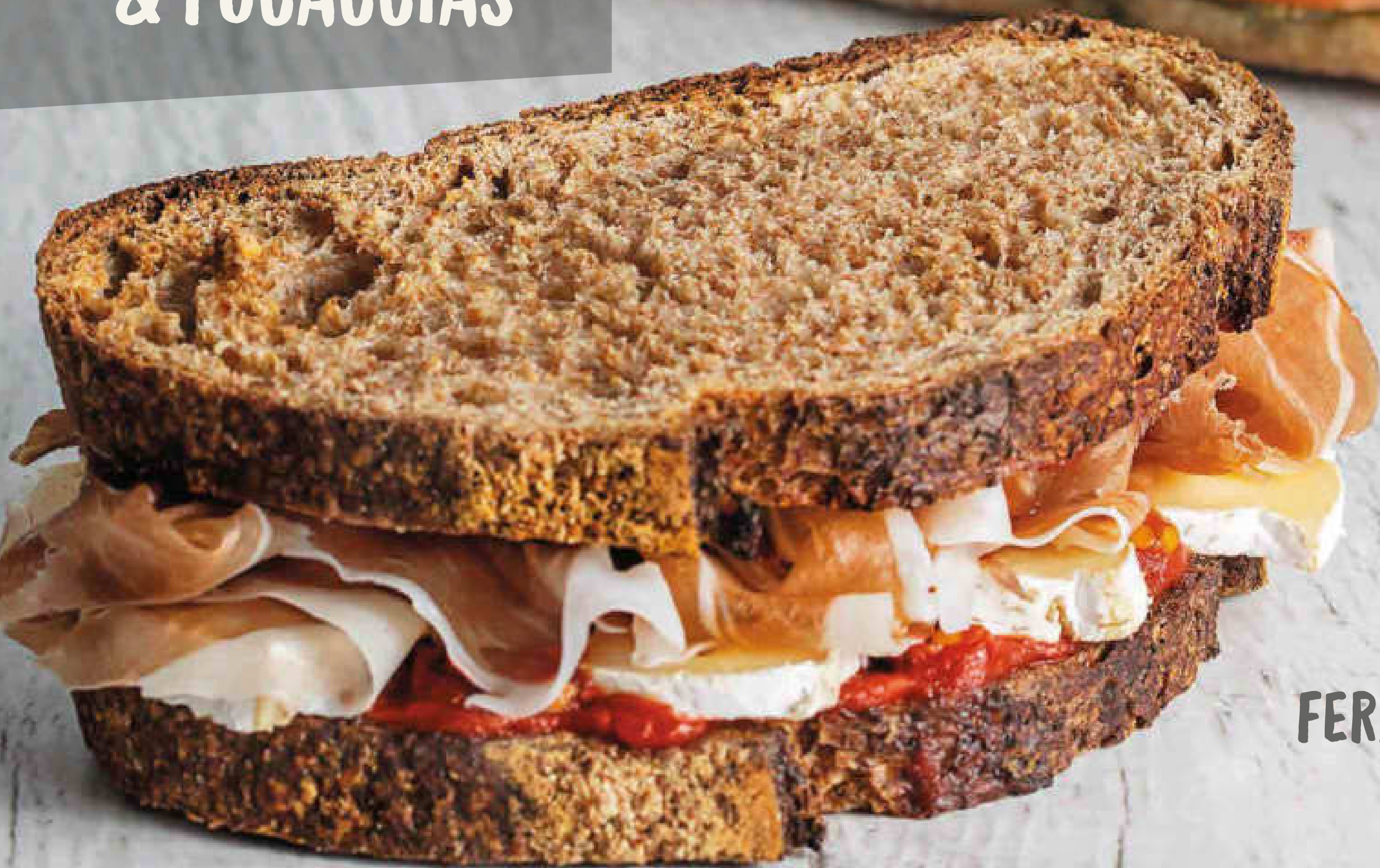
Pan de campo serrano