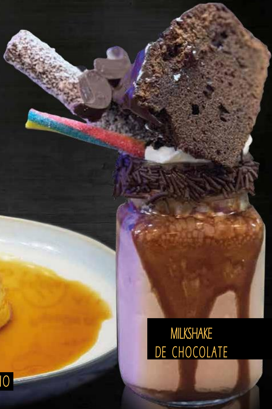
MILKSHAKE DE CHOCOLATE