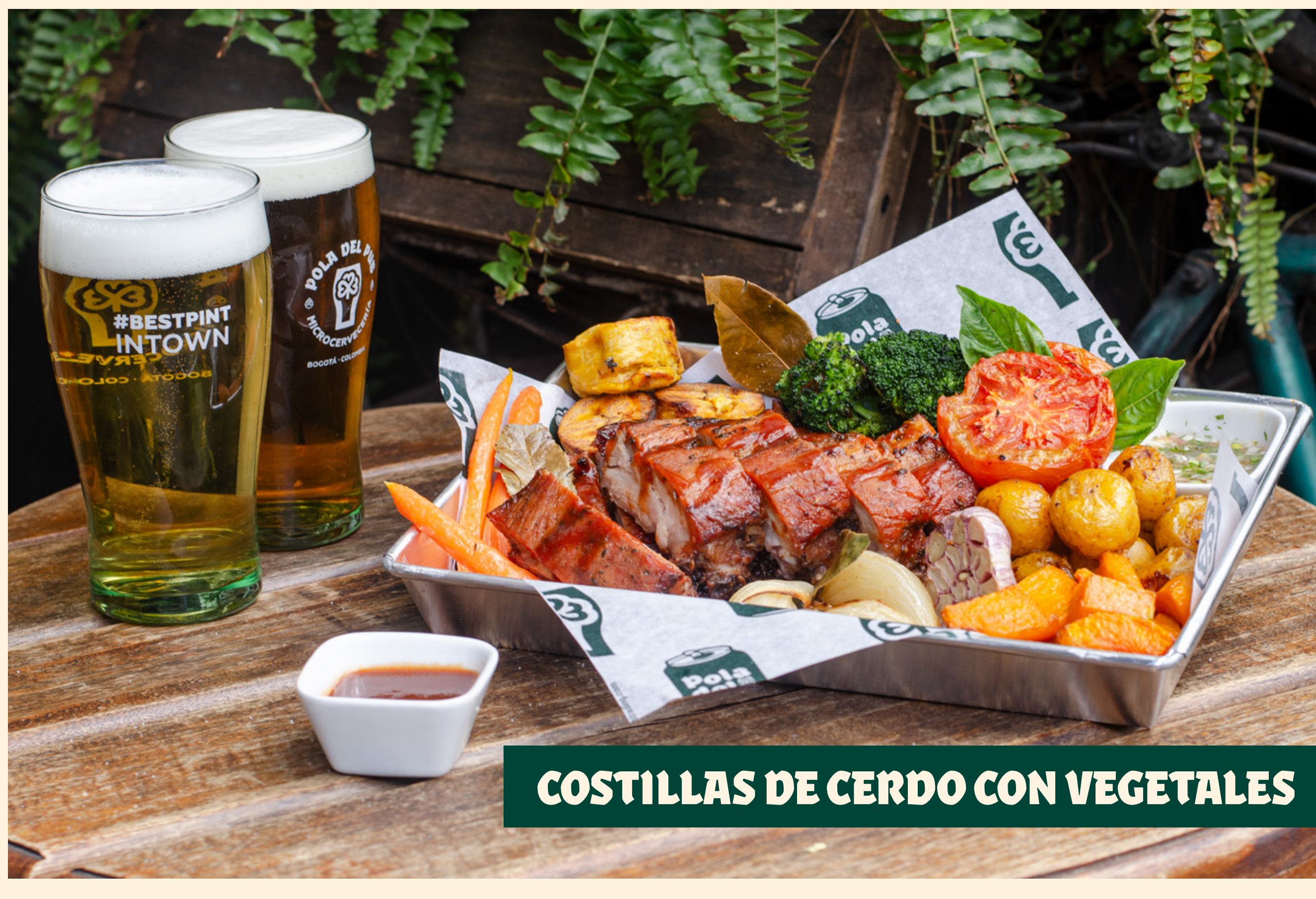
COSTILLAS DE CERDO CON VEGETALES