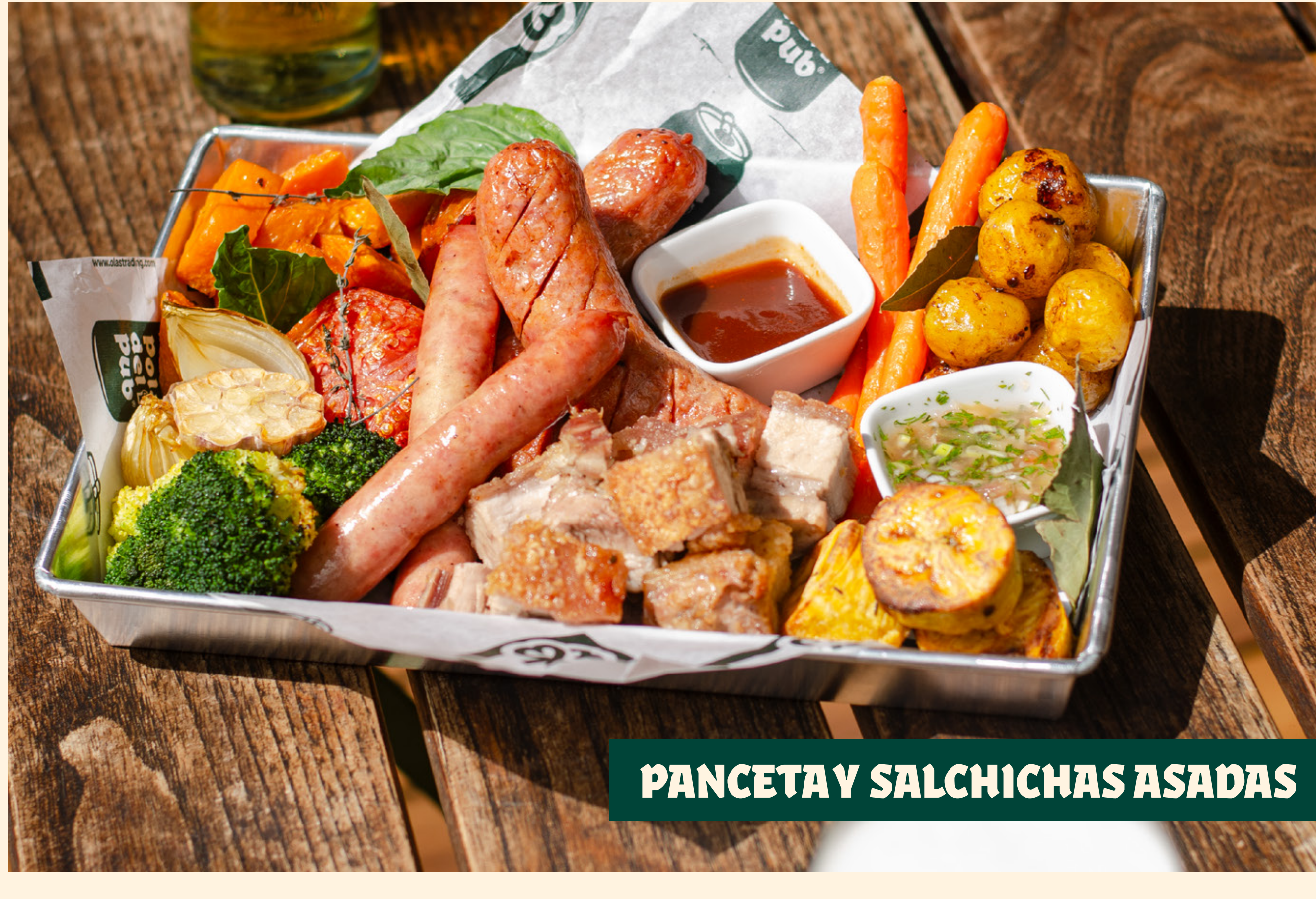
PANCETA Y SALCHICHAS ASADAS