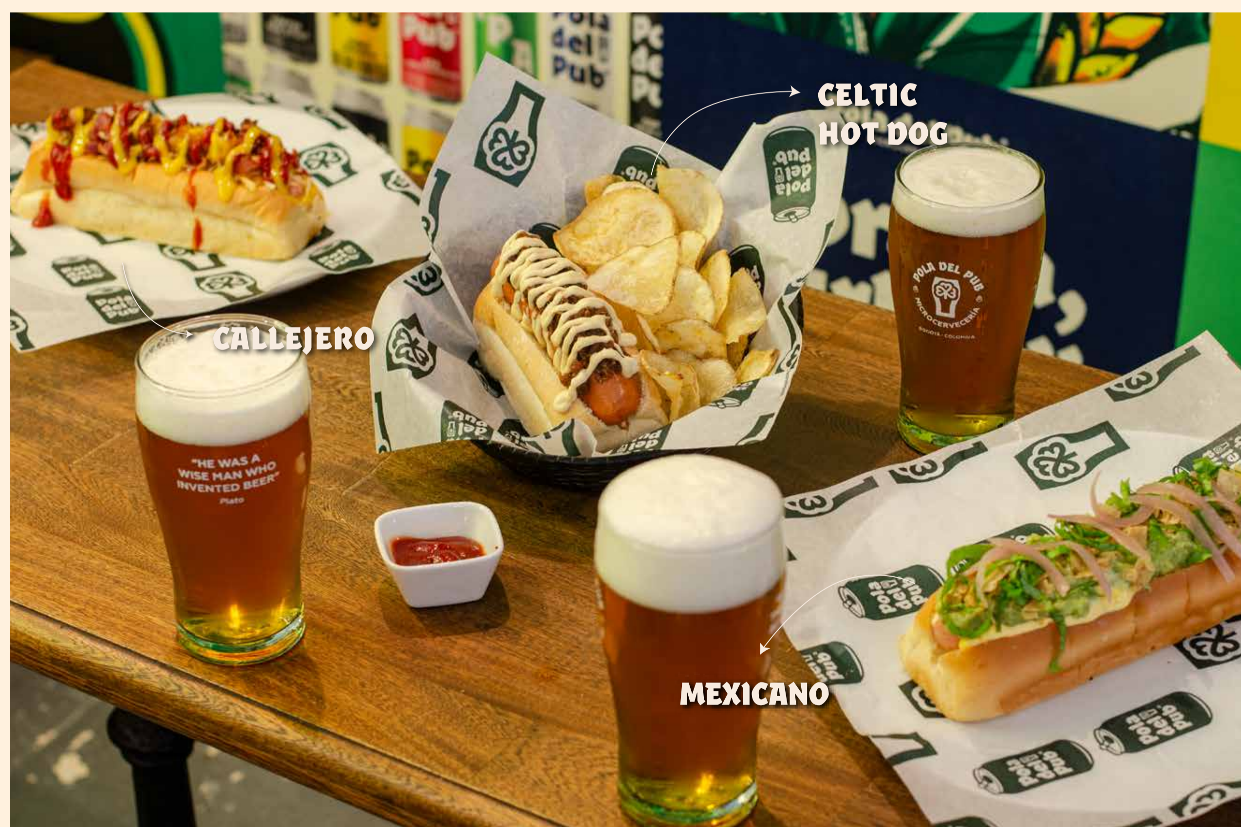
CELTEIC HOT DOG