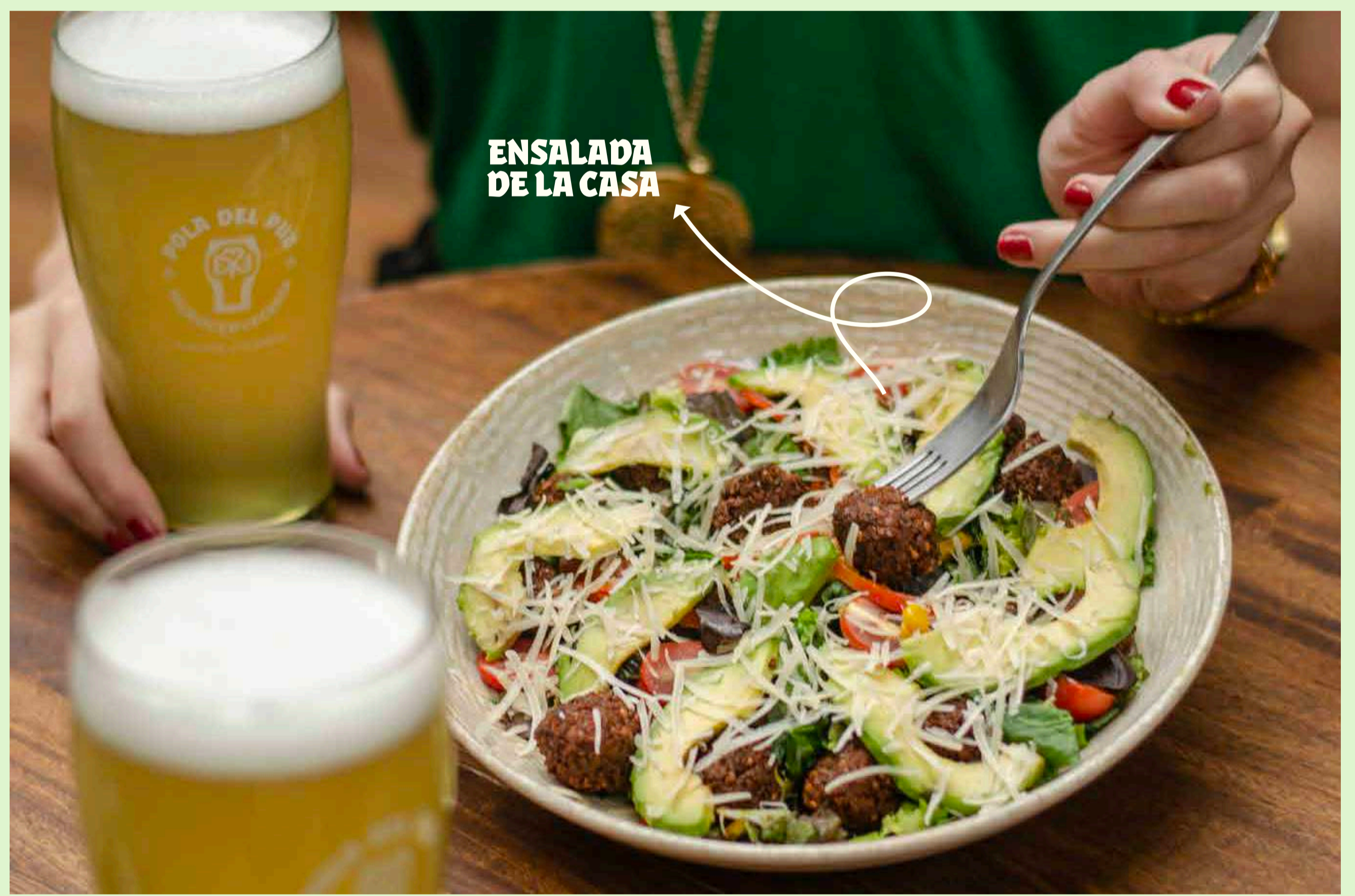
ENSALADA DE LA CASA

Se estima que la producción de carne es responsable del 14,5% de las emisiones globales de gases de efecto invernadero.