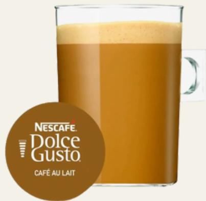
Café con leche