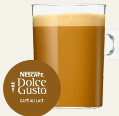
Café con leche