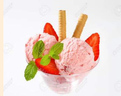
COPA DE HELADO