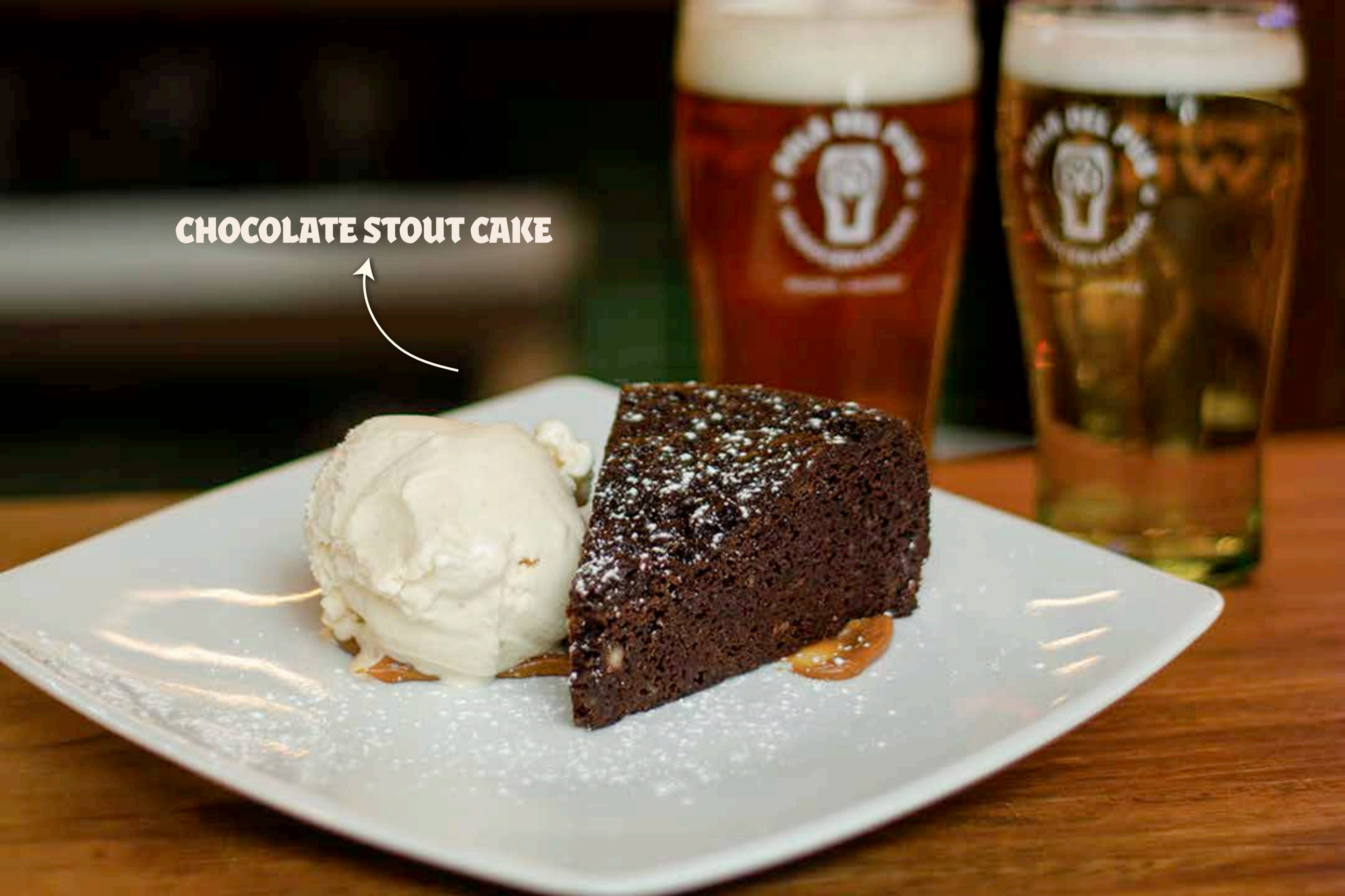
CHOCOLATE STOUT CAKE