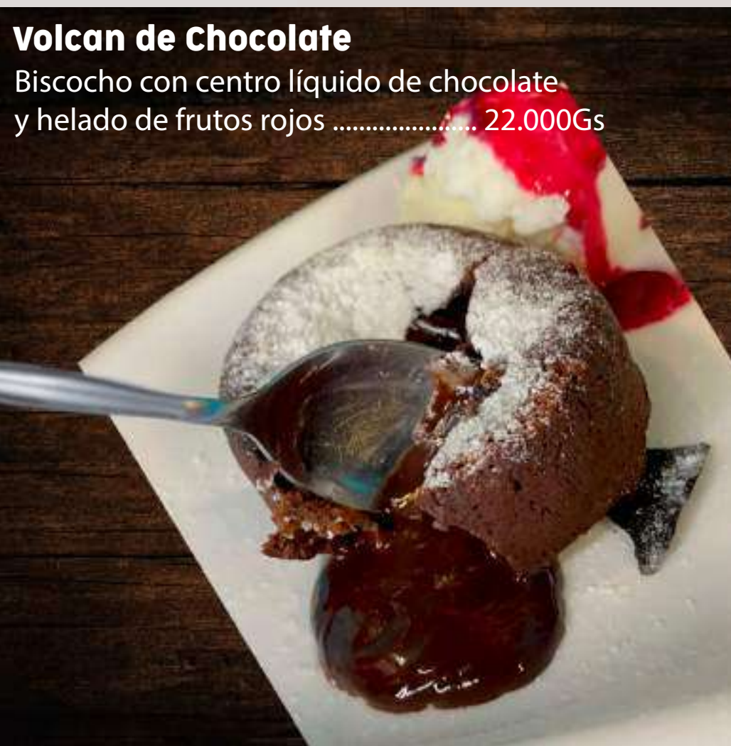
Volcan de Chocolate Biscocho con centro líquido de chocolate y helado de frutos rojos ..... 22.000Gs