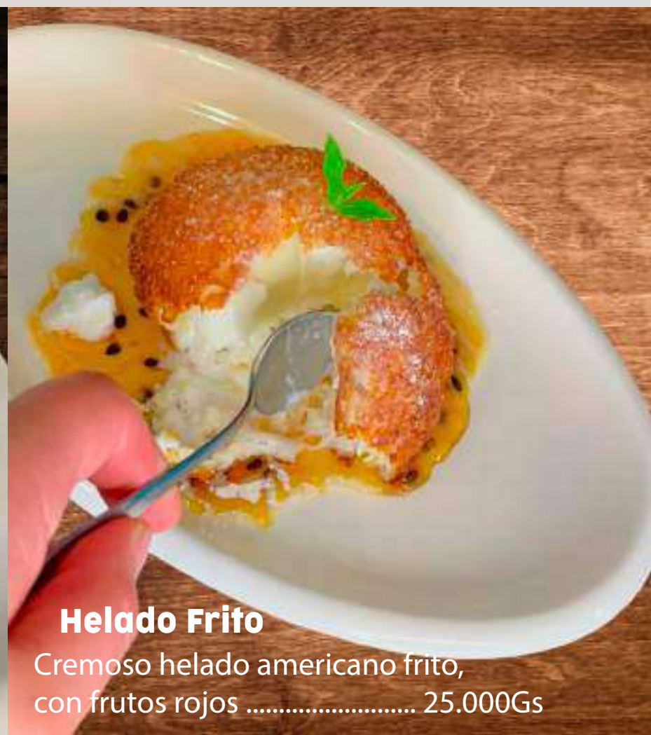
Helado Frito Cremoso helado americano frito, con frutos rojos ..... 25.000Gs