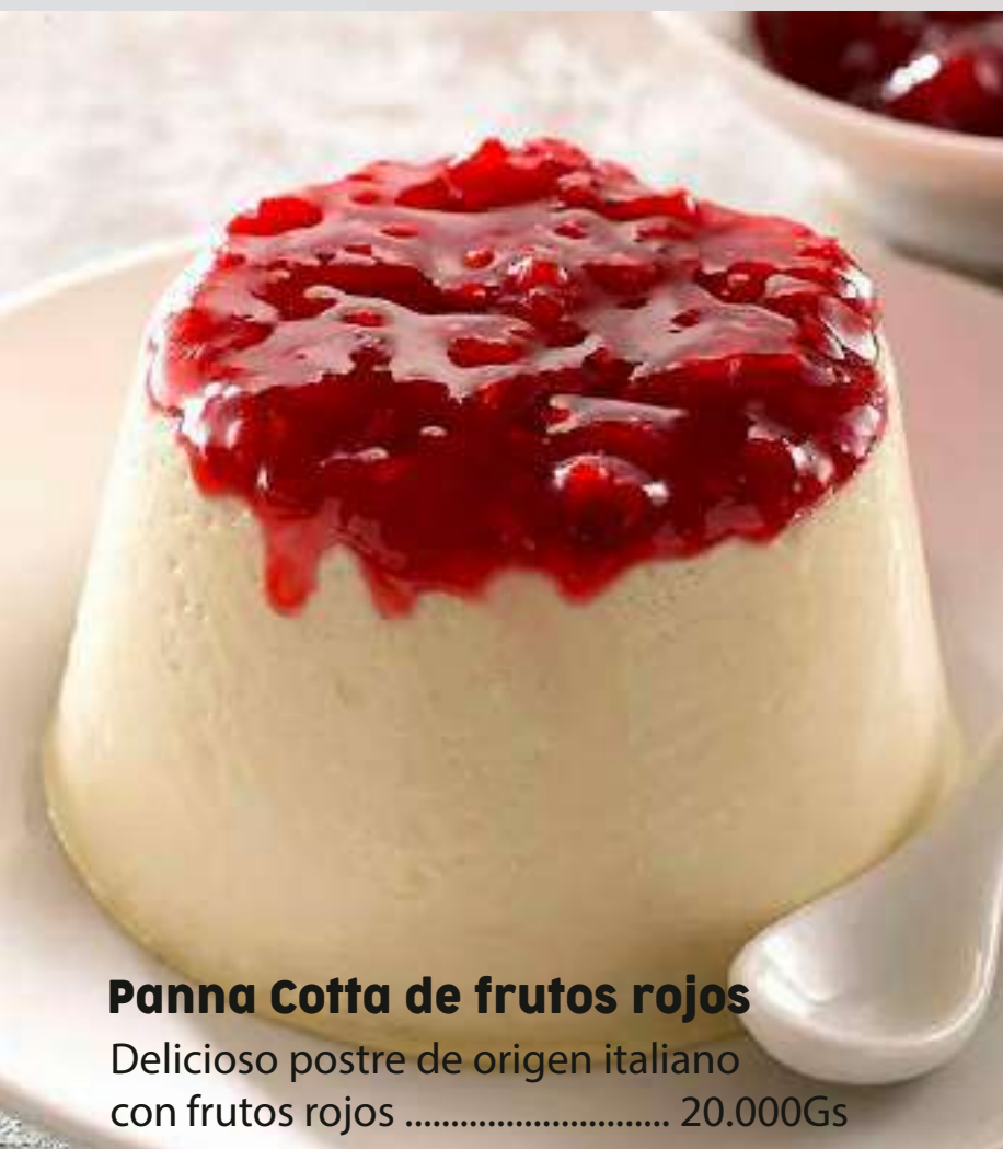
Panna Cotta de frutos rojos Delicioso postre de origen italiano con frutos rojos ..... 20.000Gs