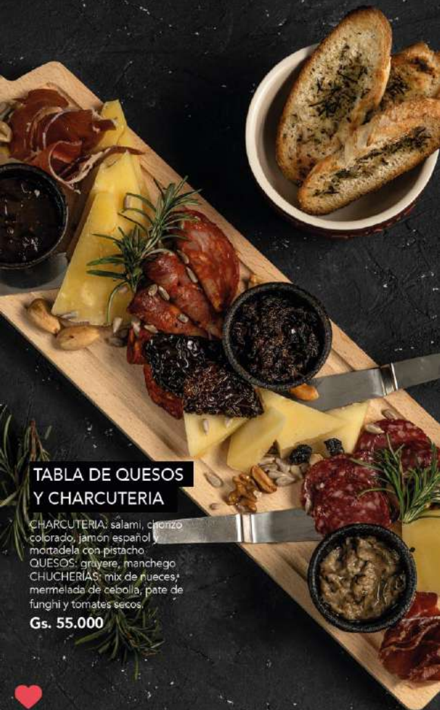
TABLA DE QUESOS Y CHARCUTERIA

CHARCUTERIA: salami, chorizo colorado, jamón español y mortadela con pistacho.