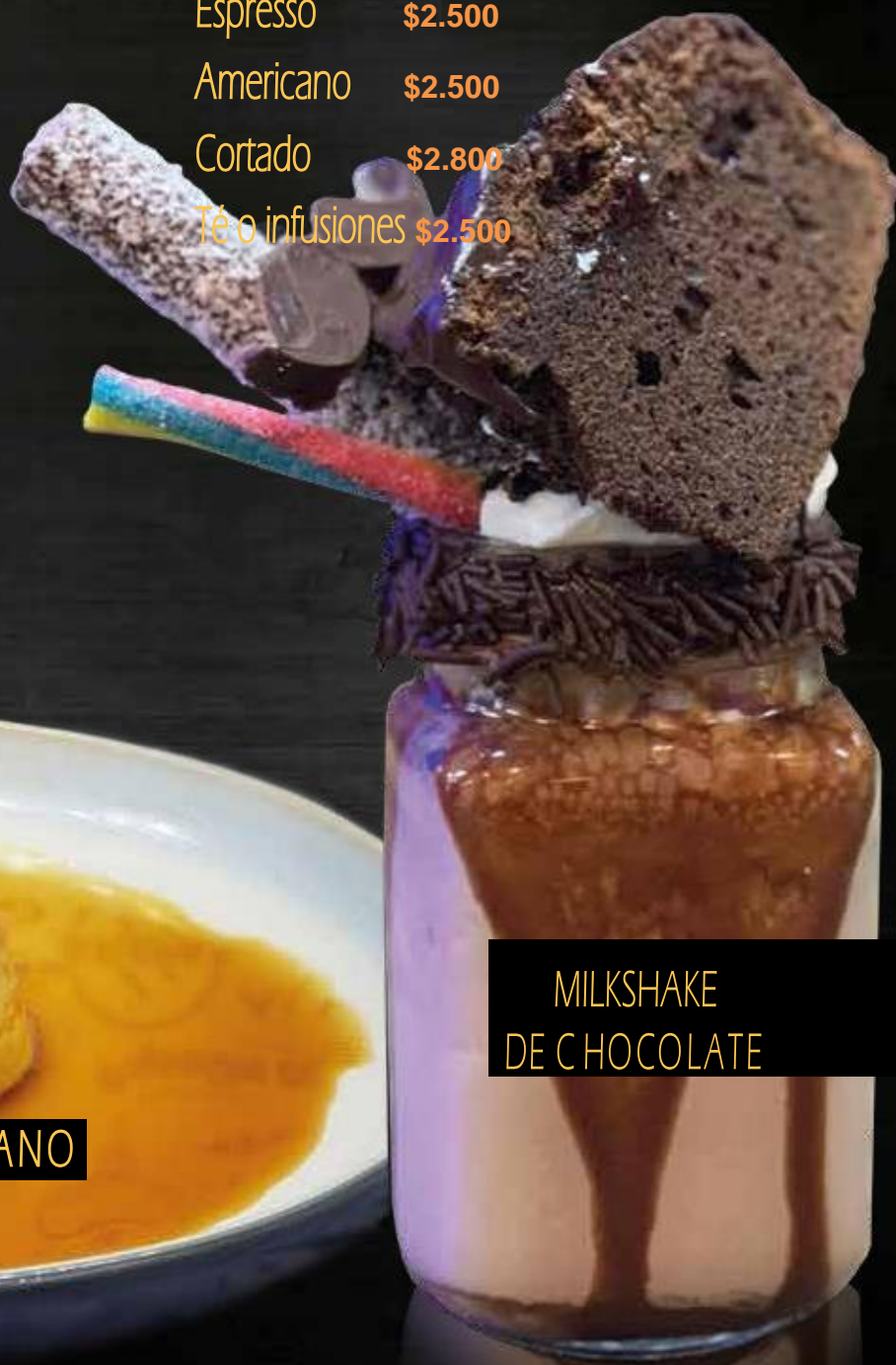
MILKSHAKE DE CHOCOLATE