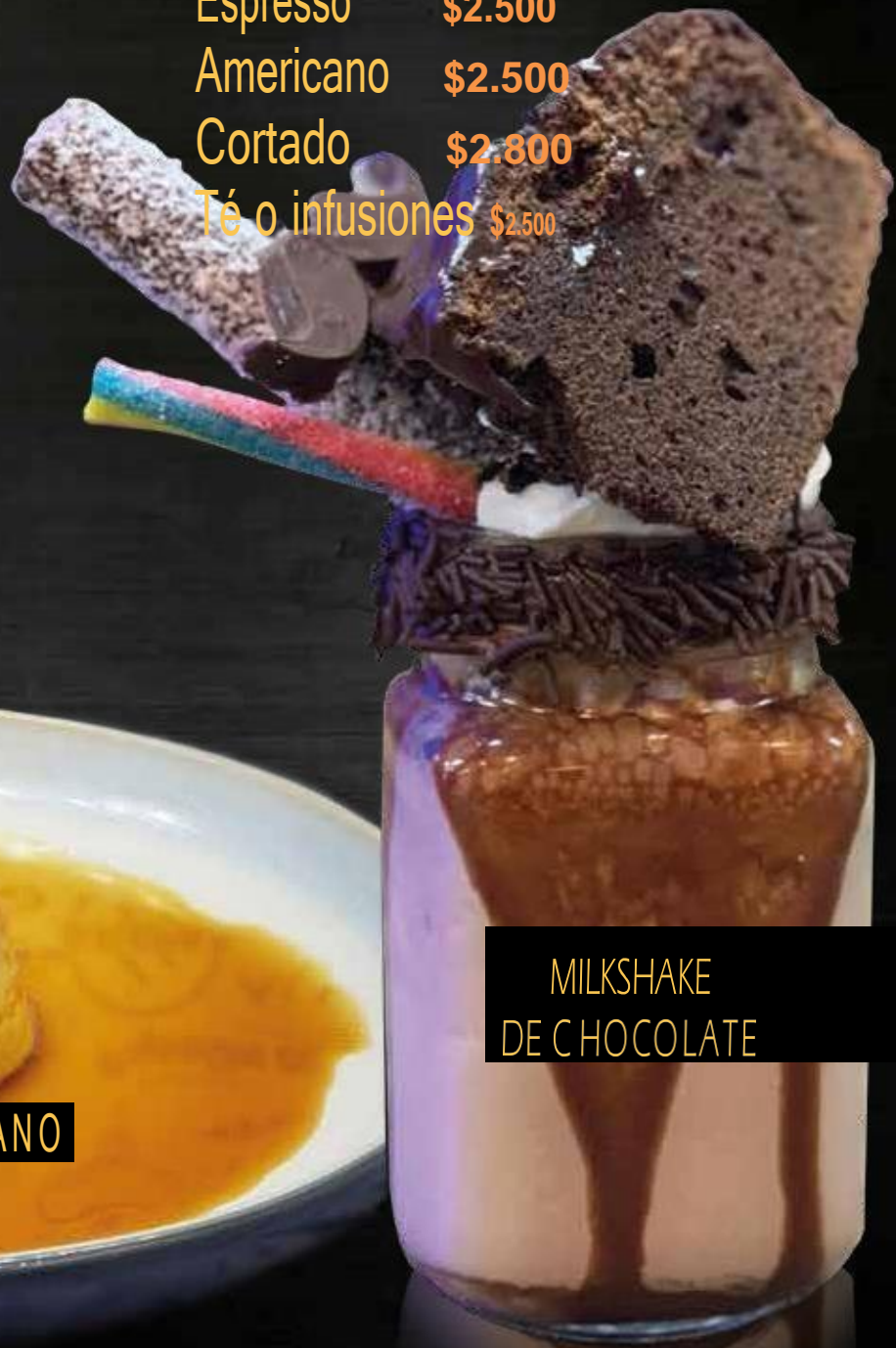
MILKSHAKE DE CHOCOLATE