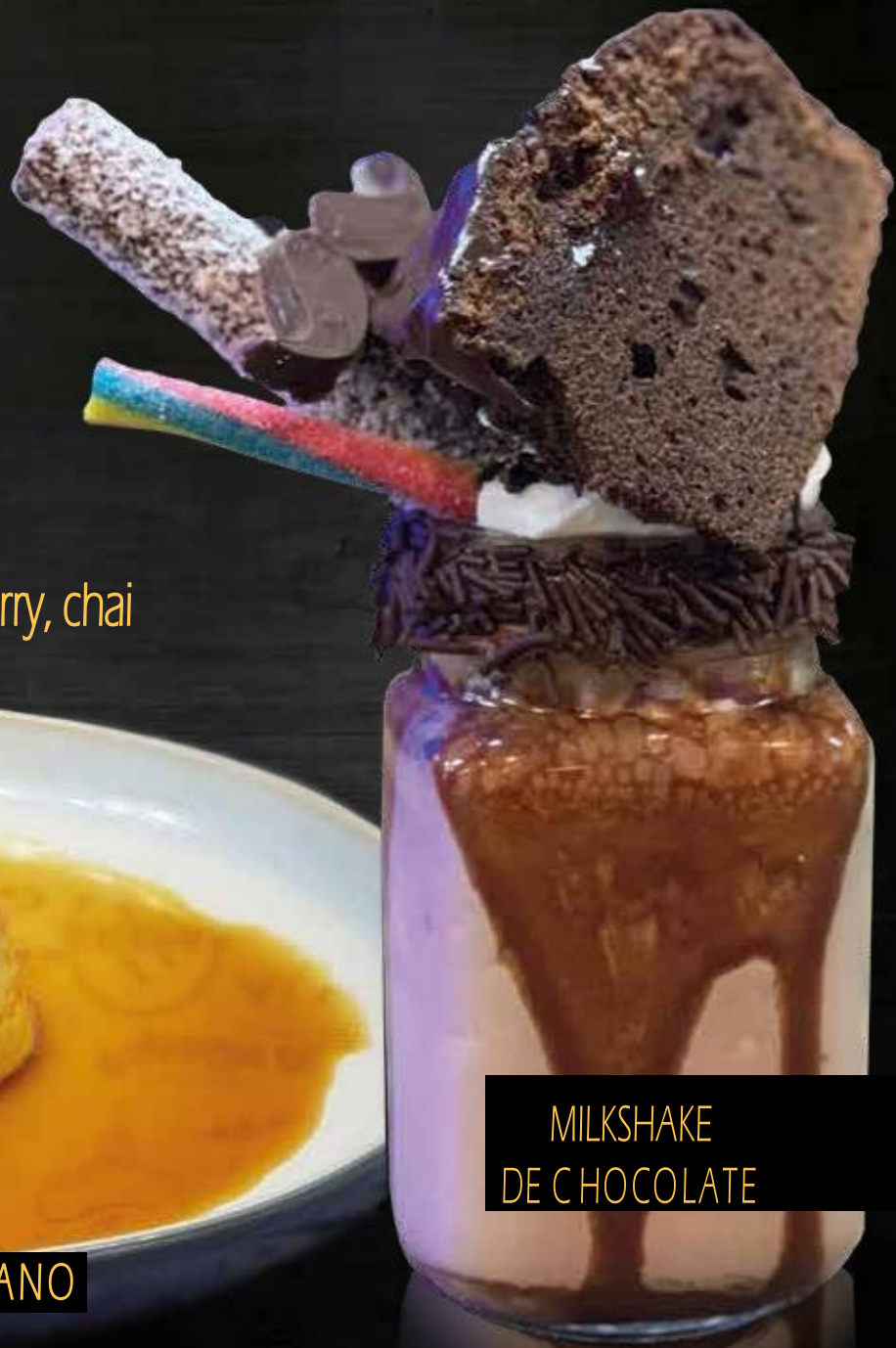
MILKSHAKE DE CHOCOLATE