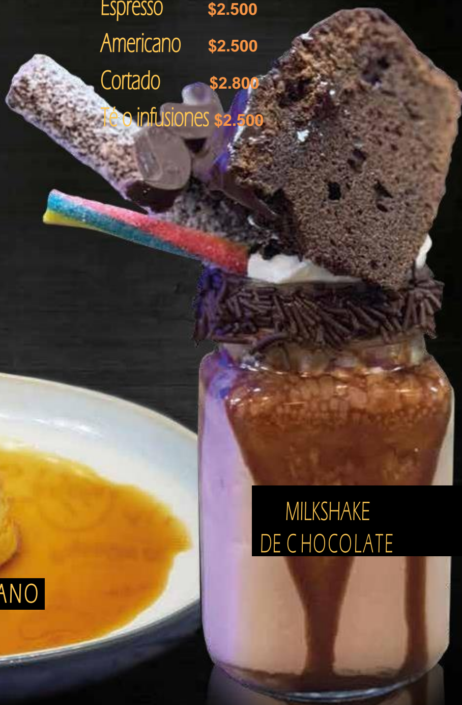
MILKSHAKE DE CHOCOLATE