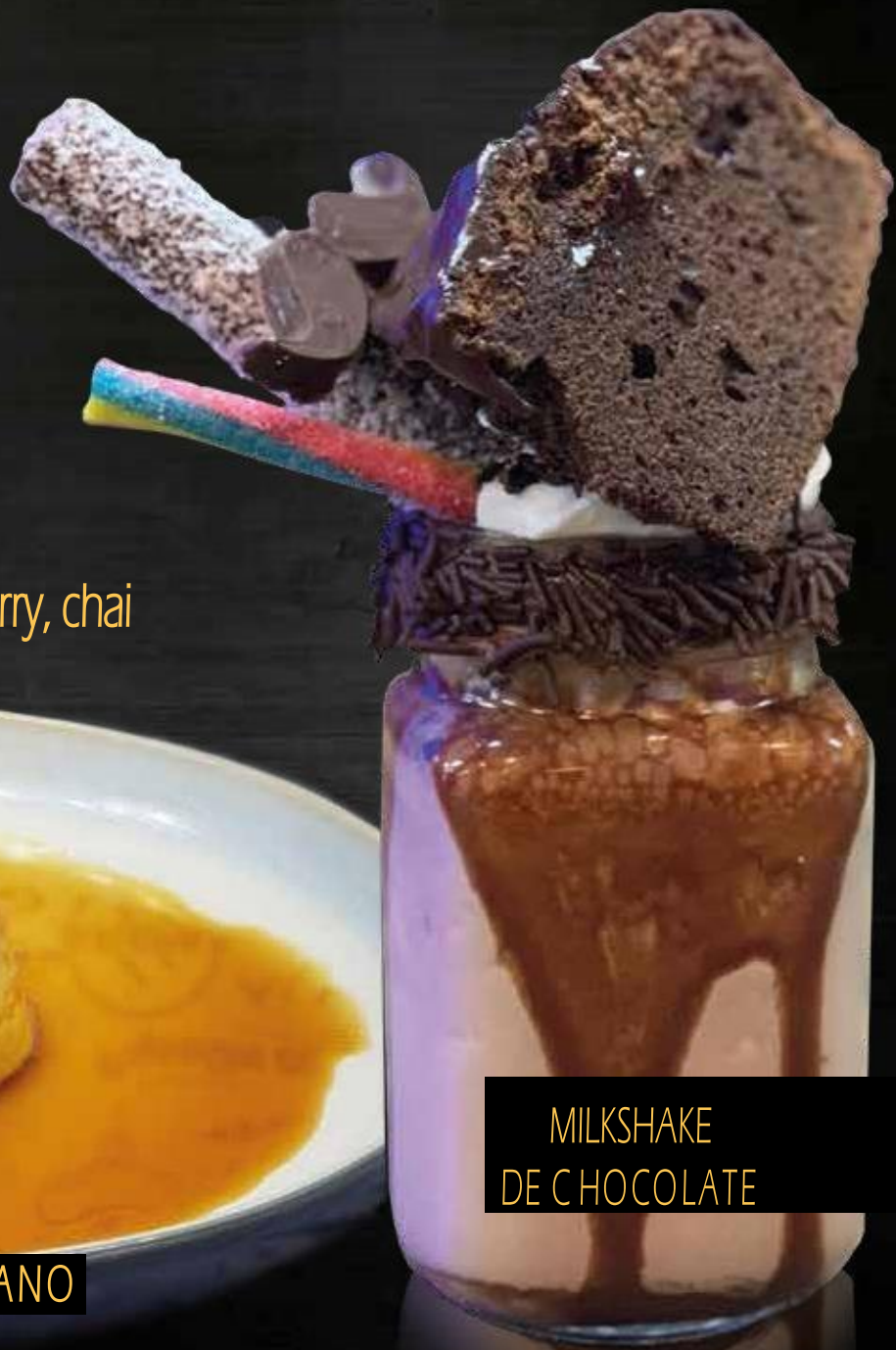
MILKSHAKE DE CHOCOLATE