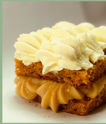
TORTA DE ZANAHORIA $ 6,000 - 20,000 - 30,000