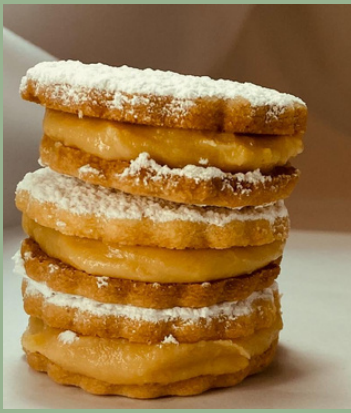
ALFAJORES Uni: $ 2,000