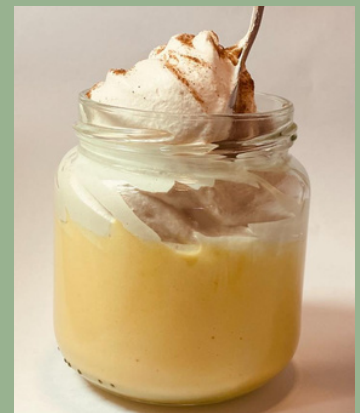
SUSPIRO LIMEÑO $ 6,000 - 20,000 - 30,000