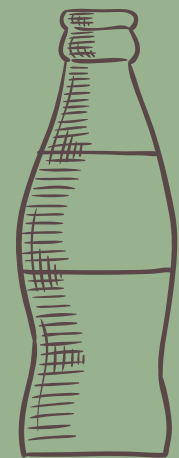
GASEOSAS *COCA COLA *COCA COLA ZERO *GINGER $ 3,500