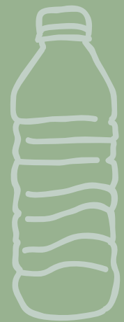
AGUA CON/SIN GAS $ 4,000