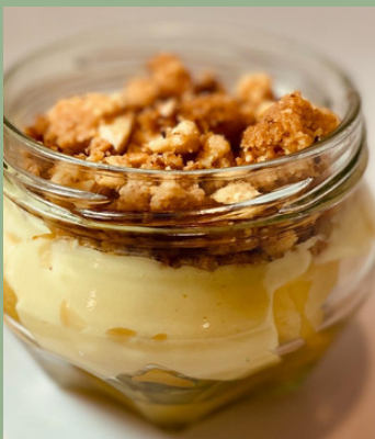
CROCANTE DE MANZANA $ 6,000 - 20,000 - 30,000