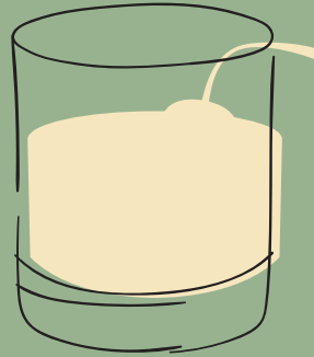
PISCO SOUR $ 25,000 (X2 PARA LICUAR EN CASA CON CUBOS DE HIELO)