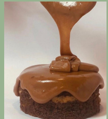
TORTA HUMEDA DE CHOCOLATE $ 6,000 - 20,000 - 30,000