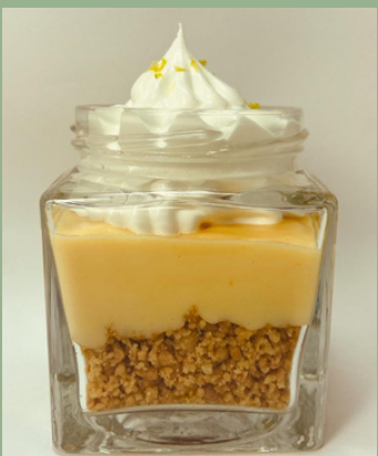
PYE DE LIMON $ 6,000 - 20,000 - 30,000