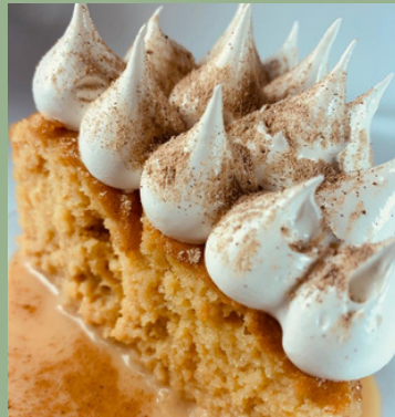
TORTA TRES LECHE DE AREQUIPE $ 6,000 - 20,000 - 30,000