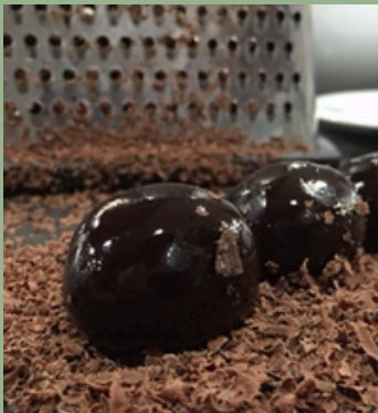
TRUFAS LIMEÑAS Uni: $ 2,000