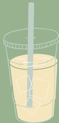
SANA TODO BEBIDA DE LA CASA A BASE DE LIMONARIA, MANZANILLA Y PIÑA $ 8,000