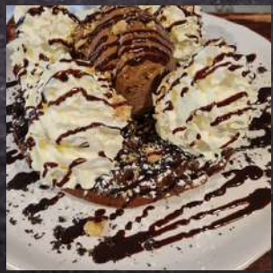
WAFFLE CHOCO NUTELLA