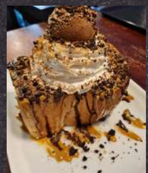
REAL CHOCO BREAD