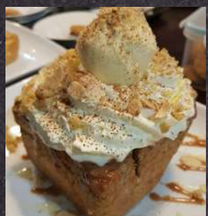
HONEY BUTTER BREAD