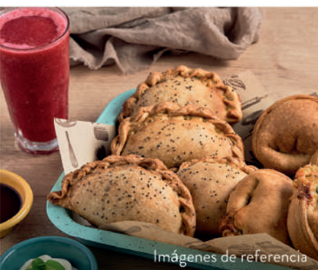
Imágenes de referencia