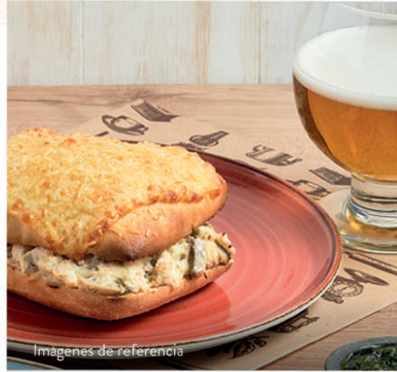
Imágenes de referencia