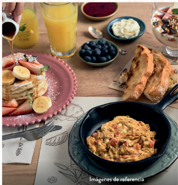
Imágenes de referencia