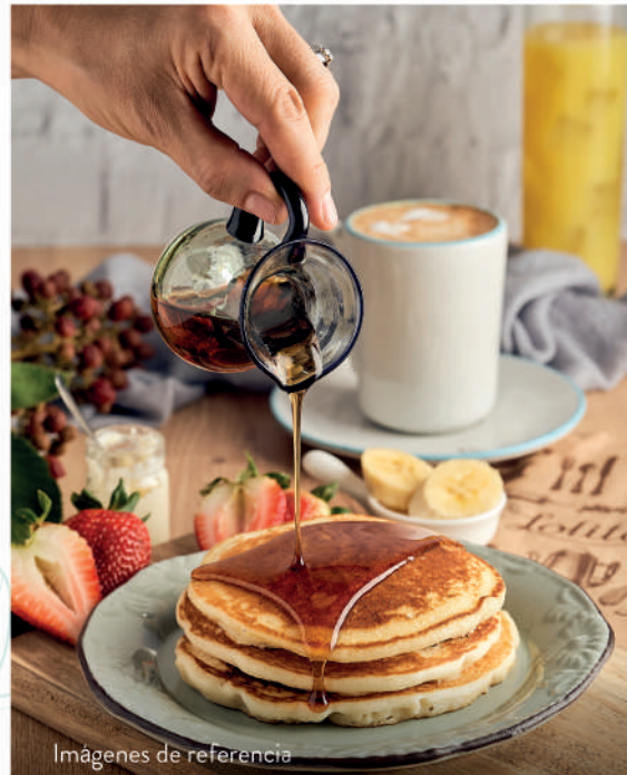
Imágenes de referencia