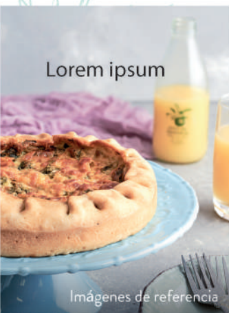
Imágenes de referencia