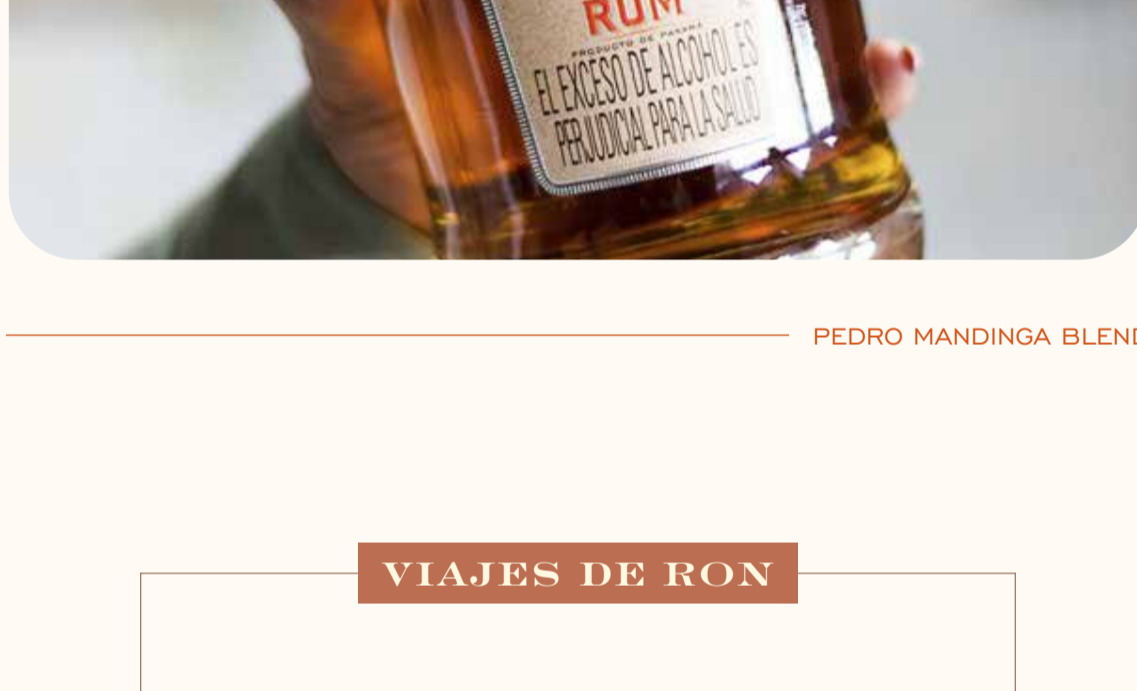
PEDRO MANDINGA BLEND