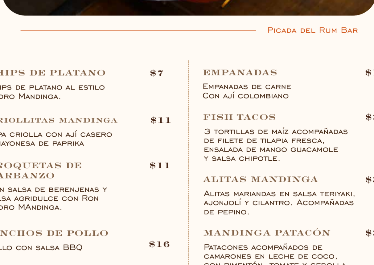
PICADA DEL RUM BAR