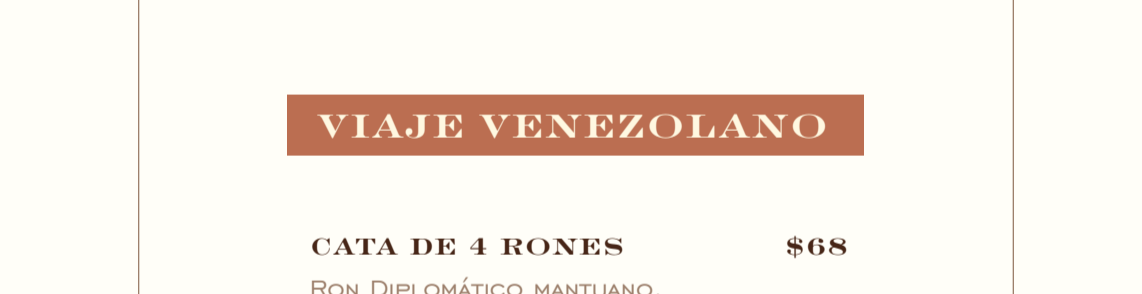
PEDRO MANDINGA BLEND