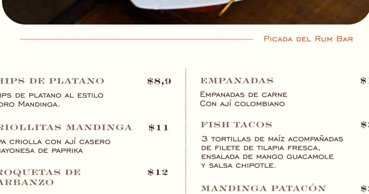
PICADA DEL RUM BAR